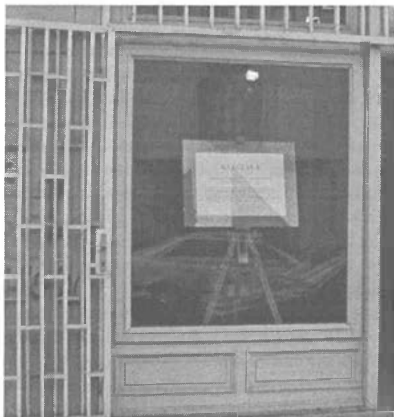
Vitrina pred dvorano Zemljepisnega muzeja z vabilom na likovno razstavo ob Dnevih Inštituta za slovensko izseljenstvo.

In sedaj je pred vami še objava celotnega dogajanja – v sliki in besedi. Preden se