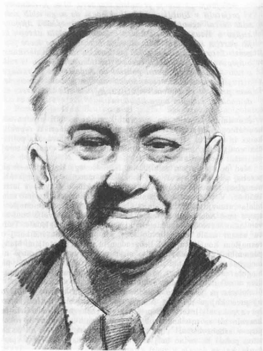
Louis Adamič, risba neznanega avtorja (Inštitut za slovensko izseljenstvo ZRC SAZU)