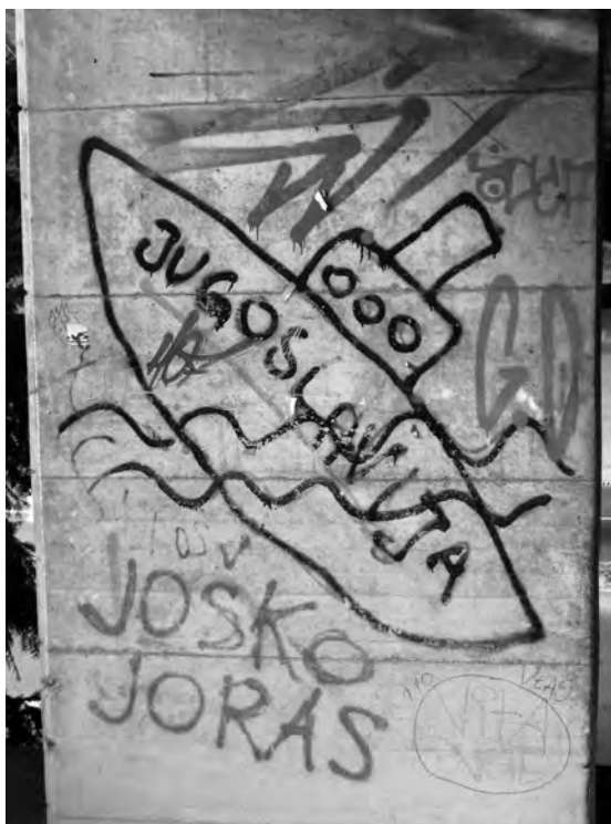
Grafit, Ljubljana, 2013

V enem med podhodi v središču Ljubljane je že petindvajset let na ogled grafit, na katerem je potapljaljoča ladja z imenom Jugoslavija. Čeprav so v tem času okoli njega nastali mnogi drugi novi grafiti in tagi, je v svojem bistvu ostal nedotaknjen. Razumem ga kot simptom ambivalentnega, celo polivalentnega odnosa Slovencev do svoje nedavne preteklosti, ki odpira vprašanja, kako se Slovenci danes, v svoji aktualni domovini, spominjajo svoje nekdanje, jugoslovanske domovine. 1