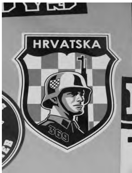
Nalepka, Zagreb, 2016