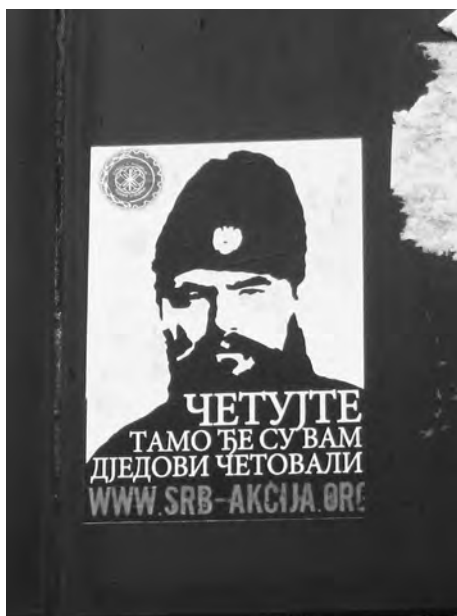
Nalepka, Banja Luka, 2015

Drugi ideološki antagonizem je konkretnější, spusti se na raven personalizacije ideologije in politike. Gre za boj kulta proti kultu: Tito versus njemu nasprotne politične osebnosti. Tako je najti šablone s podobami Tita (Prizren, 2008; Ljubljana, konec devetdesetih), street-art instalacije (z zlato bravo prebarvan star Titov kip, ki ima na prsih narisano modro srce / Maribor, 2015/), grafite z njegovim imenom v različnih izpeljankah (zasledil sem jih praktično povsod po nekdanji Jugoslaviji), po njem se imenujejo ceste ( Tito Way / Ptuj, 2014/, Titova cesta / Cesta na Trnovo, 2013/), njemu so posvečena različna gesla in prisege ( Mi smo Titovi / na magistrali Sarajevo–Doboj, 2014 /, Tito je naš / Zagorje, 2014/). Njegovi nasprotniki seveda poudarjajo njegove nekdanje sovražnike ( Vuk Rupnik, vstani! / Ljubljana, 2014/, Momčilo Đujić / Banja Luka, 2015/, Ante Pavelić / Ljubljana, 2012/). Tudi tu se bijejo ostre zidne polemike: v Ljubljani (2015) so tako dorisani komentarji Živio in rdeče zvezde na izvorni grafit Josip Broz Tito vaginalni izbljuvek . Tito in »anti-Tito« tu nastopata kot konkretizirani, v lik voditelja »utelešeni« konotaciji prvega binarizma, socialističnega federalizma in nacionalizma.