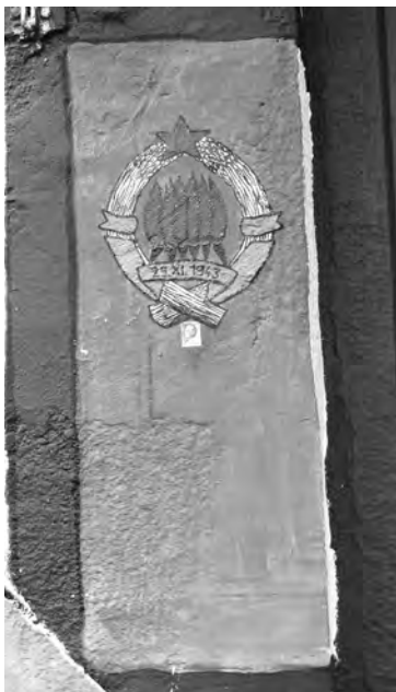
Grafit, Maribor, 2015

Iz tega razloga sem pomen grafita raziskoval na mestu podobe same, ne pa na mestih njenega nastanka ali ogledovanja oziroma povzročenih učinkov. 5 Vendar ob tem opozarjam na pomembnost njegove okolice: za razumevanje grafita ni dovolj le »dobro oko«, njegovi kompozicijska interpretacija in moč same podobe, ampak tudi njegova umestitev. Pomembno je kontekstualno znanje: ne le oblikovno, pač pa tudi ali celo predvsem socialno in ideološko. Drugače rečeno: vizualno analizo je treba delati skupaj z nevizualnim ozadjem, ki podobo estetsko in ideološko umesti v njeni celoti.