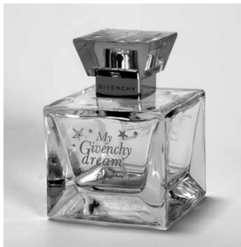
Slika 7. Parfum za srečo (Iz zbirk SEM, foto: M. Habič).

Sodobne oblike vraževerja imajo svoje korenine v preteklosti, a so jih ljudje prilagodili trenutnim potrebam, času in prostoru. Lahko bi rekla, da je vraževerja vedno več, saj je z novimi tehnologijami in možnostmi komuniciranja vedno dostopnejše. Nekoč so se verižna pisma za srečo in bogastvo pošiljala po pošti, danes v obliki predstavitev (powerpoint)