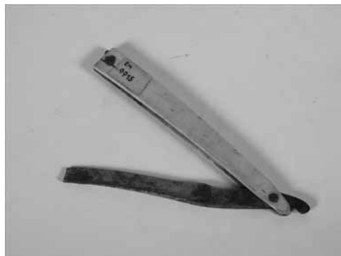
Slika 4. Britev za britje glist, Bela Krajina.

Za muzejsko zbirko je izrednega pomena gradivo, zbrano v času terenskega dela na Pohorju: pripovedi ljudi so zapisane, fotografsko dokumentirane, posnet je bil etnografski film, pridobljeni so bili predmeti. Z dobrim dokumentiranjem se je ohranila nesnovna kulturna dediščina, ki je v primeru te zbirke več kakor muzejskih predmetov.