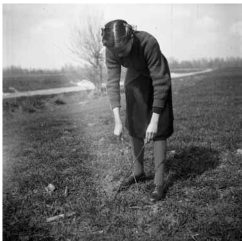
Slika 1. Na cvetno nedeljo zataknejo v njive šibe od presmeca, Veržej. Teren I - Koroška, Štajerska, Prekmurje, 1959.

v ljudsko religioznost, saj gre za nabožne predstave in kulturne prakse, ki so drugačne od teološke doktrine in cerkvene liturgije, saj gre za nepoklicno izvajanje nekodificiranih obredov, ki so lahko v simbiozi s cerkveno doktrino ali pa samo njena svojevrstna interpretacija (Makarovič 2004: 290). Pri tem se verniki ponavadi ne zavedajo, da z dejanji, ki jih cerkev ni potrdila, kršijo njeno učenje. Živijo namreč v globokem prepričanju, da posebno intenzivno spoštujejo cerkvene predpise in jih prakticirajo v vsakdanjem življenju. Menijo, da izvajajo nekakšno nad-vero; dejanj v zvezi z njo ne povezujejo s praznoverjem. Pri tem se neredko praznoverna sentenca podkrepi z dodajanjem svetih imen, da bi se povečala verjetnost izpolnjenih želja (Hiller 1989:224). Pri ljudskem verovanju je mogoče pri vsaki vključitvi in uporabi magičnih in čarobnih elementov (predmetov) najti povezavo s krščansko vero (Ficker 2007: 191). In tako se cvetnonedeljska butara, ki ima pomembno vlogo pri bogoslužju, spremeni v obrambni predmet pred naravnimi silami in dobi nadnaravno moč.