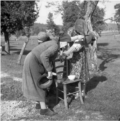
Slika 2. Delajo zaurojk, Zadlog, Teren 16 - Črni Vrh - Vojsko pri Idriji, 1959.