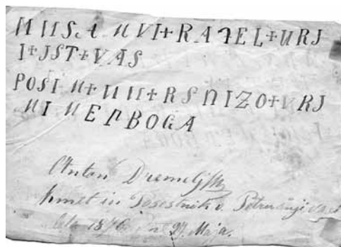
Slika 5. Cejgela za pomoč zoper žleh človeka (Iz dokumentacije SEM).

S pridobivanjem predmetov vraževerja pa je težko, saj jih ljudje potrebujejo in še vedno uporabljajo. Nič drugače najbrž ni bilo tudi pred pol stoletja, ko so pripravljali razstavo. Glede na zapise v inventarnih knjigah je bila polovica predmetov kupljenih, torej so bili novi ali pa narejeni posebej za razstavo. Sami predmeti niso imeli vraževerne funkcije, služijo le kot ponazorilo. Pogosto pa je vraža povezana z naravnimi materiali,