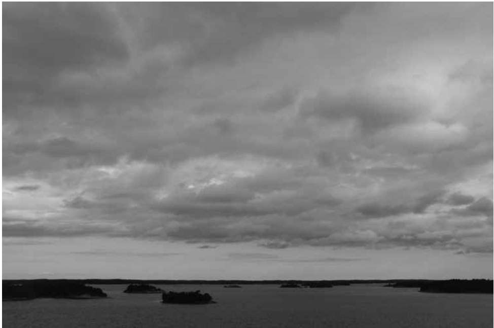
Slika 2. Jugozahodni finski arhipelag. 2012.

V kontinuumu opredelitev arhipelaga obstaja več različnih manjših arhipelagov, ki jih lahko tudi ena sama oseba v različnih situacijah opredeli na več načinov. Ideje o konceptu arhipelaga se nenehno spreminjajo, predvsem pa je zaradi novega mostu ali trajekta treba na novo opredeliti celo, kaj sploh je pravi simbolični arhipelag. V glavnem arhipelag sestavljajo območja, ki so povezana z vsakdanjimi aktivnostmi, prometnicami in plovnimi potmi, medtem ko so druga območja še vedno nepoznana. Tudi nepoznana območja lahko tvorijo arhipelaško okrožje, pri čemer materni jezik ljudi ni večinski jezik. V takšnih primerih se območje ne opredeljuje kot simbolno, ampak kot domačno, kjer prevladujejo običajne dejavnosti. Tako kot v zunanjem arhipelagu gre jezikovno mejo razumeti tudi kot simbolno mejo. V tem primeru je meja arhipelaškega območja zunaj ali v arhipelagu samem. V slednjem primeru gre za dvojezični arhipelag, kjer je jezikovna meja ena od njegovih značilnosti (Siivonen 2010: 53–54; Siivonen 2008: 153–178).