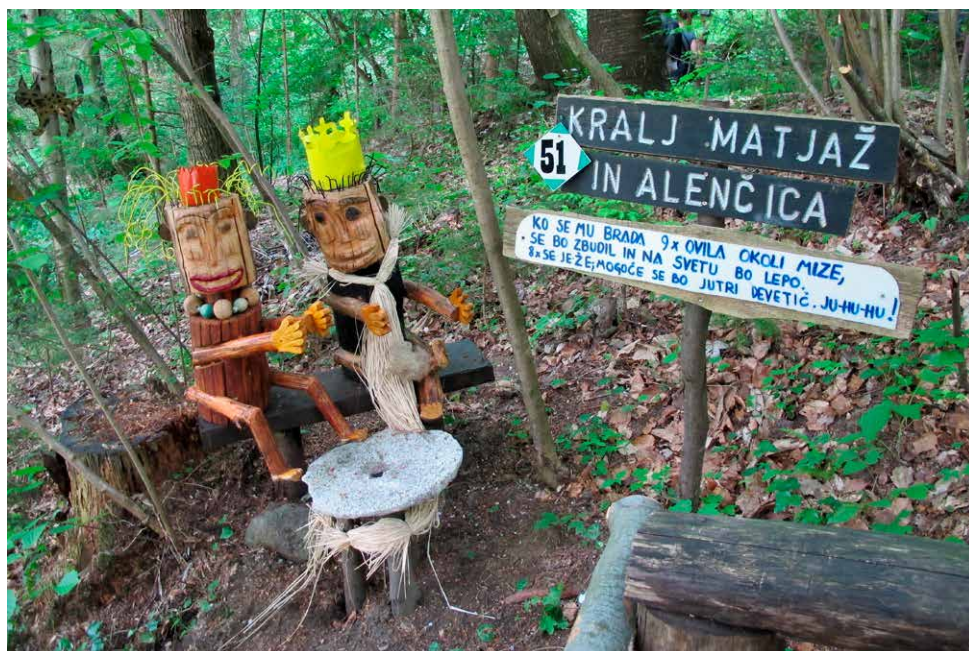
Eden izmed predstavljenih pravljčnih junakov pri Koči pri čarovnici v Olimju.