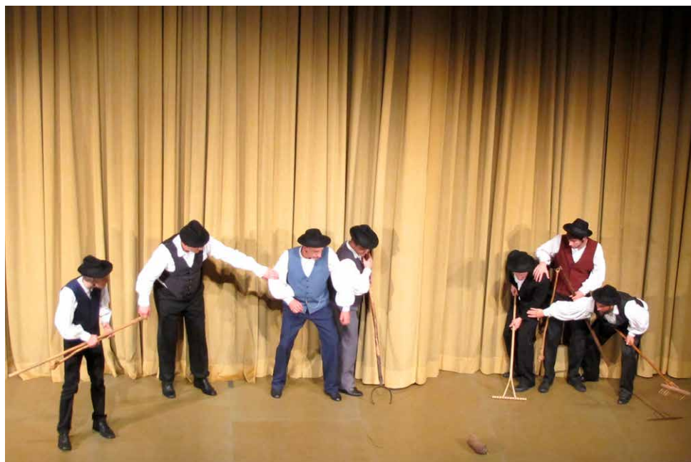
Prizor iz predstave Izgubljeni zaklad – uprizoritev šaljive zgodbe Kako so Lemberžani kašnato klobaso ustrelili . Foto: Katarina Šrampf Vendramin, 2014.