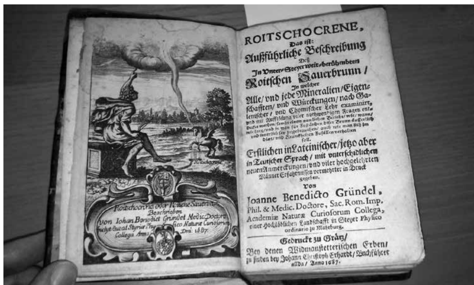
Fotografija strani knjige Johana Benedicta Gründla z naslovom Roitschocrene , kjer je upodobljena legenda o Pegazu in njegovem odkritju mineralne vode v Rogaški Slatini. Foto: Katarina Šrumpf, 2014.

Med vsemi predstavljenimi oblikami folklorizma ali izumljenih tradicij pa je najzanimivejša podoba Pegaza, ki je simbol Občine Rogaška Slatine. Ker se je kot simbol pojavil razmeroma pred kratkim, lahko sledimo procesom ustvarjanja in identifikacije s tem simbolom ter s tem tudi poudarjanju in nenehni graditvi lokalne pripadnosti, ki jo omogoča podoba mitološkega krilatega konja.