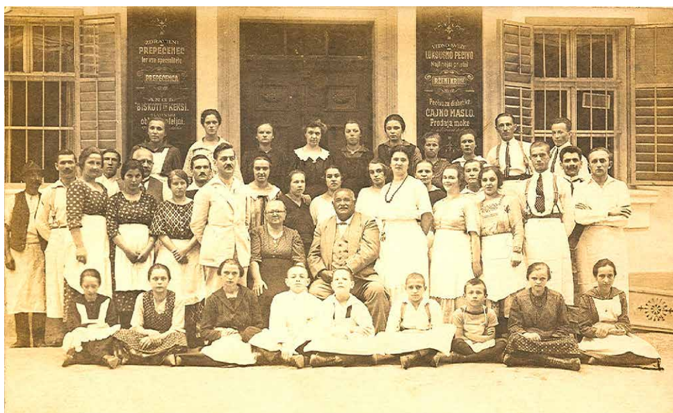
Uslužbenci pred obratom družine Bizjak v Rogaški Slatini

akademski koncepti nanašajo na ureditve in prakse vsakdanjika, na podlagi izhodišča, da moramo danes besedno zvezo »delati/ustvarjati kulturo« razumeti hkrati kot »delovati v kulturi« in »delovati s kulturo. (Tschofen 2012: 40)