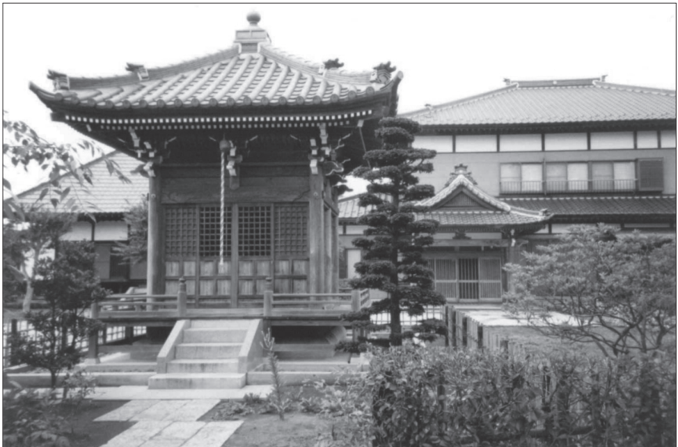
Slika 1: Svetišče in hiša na budističnem pokopališču blizu mesta Kashiwa (prefektura Chiba). Na gradnjo budističnih stavb je zelo vplival kitajski slog gradnje.

Ključne značilnosti te definicije so ideal kontinuitete in prenašanje nekaterih oblik dragocene lastnine (ime, zemlja, nazivi, svetost, tudi nadnaravne sposobnosti) in strateško črpanje iz »jezika bližnjega ali daljnega sorodstva« (vključno z uporabo izmišljenega sorodstva, da bi preprečili izumrtje »hiše«).