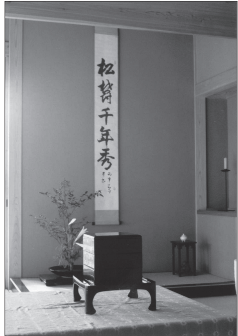
Slika 3: Tokonoma z zvitekom, ikebano in škatla s hrano – bentoubana.

Dnevna soba se je uporabljala tudi kot spalnica ( shinsbitsu ), kar izključuje trajno namestitev postelj. Vsako noč so iz omare potegnili tanke žimnice ( futon ), rjuhe, odeje in majhne trde blazine in vse to namestili na tatami . Za shranjevanje so uporabljali vgrajene omare oshiire , police zraven tokonome ali pa predale pod stopnicami. Pokriti so bili z odejo, pod glavo pa so imeli blazine ( makura ). To so bile lahke zaprte lesene škatle, na katerih je bila pritrjena majhna blazinicica v obliki valja, polnjena z ajdovo lupino. Blazine so bile tako visoke, da je na njih počivala glava, ramena so bila na tleh. To je omogočilo pretok zraka pod vratom, saj naj bi te blazine bile najbolj v uporabi v obdobjih, ko so tako moški kot ženske nosili visoko spete frizure. Drugače pa so prevladoval nizke majhne in trde blazine, prešite z blagom in polnjene z ajdovo ali sojino lupino [Morse 1972: 211–212].