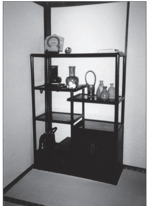
Slika 6: V sobah (hiša družine Ishiji v Kashiwi) so stvari shranjevali tudi na policah tana , na katerih so prostor našle vaze, okrasni predmeti in knjige.

V tradicionalnih japonskih hišah naj bi bilo zelo malo pohištva. Seveda so morali stvari nekam pospravljati. Za shranjevanje futonov , oblačil in podobnega so imeli vgrajene omare z drsnimi vrati, osbiire . Drugo pohištvo naj bi se bilo razvilo iz majhnih, nizkih in štirikotnih škatel za shranjevanje. Trgovci in kmetje so postajali premožnejši v edskem obdobju. Z začetkom 19. stoletja naj bi se povečalo povpraševanje po večjem pohištvu, ker majhne škatle za shranjevanje niso več zadoščale. Tako so se razvile skrinje ( tansu ), ki so bile oblikovane glede na funkcijo: kuhinjska skrinja, kusuri dansu (skrinja za zdravila), futo dansu (skrinja za pisanje) s predali za črnilo in čopič, funa dansu (ladijska skrinja), ki je bila obtežena zaradi zibanja ladje. Skrinje so vseh oblik in velikosti, narejene iz lesa in ojačene z železom, ročaji in obrobe so bili iz platine. Velike omare v hišah, pokrite z drsnimi vrati, so uporabljali za shranjevanje posteljnine in futonov . V omare tansu s predalniki, nizke omarice in predalnike pri nišah pa so spravljali majhne stvari, npr. svetilke, posodice, vaze, zvitke, kadila itn. V kuhinji, ki je bila pogosto kombinirana s spodnjim delom stopnišča, pa so spravljali stvari v omare pod stopnicami. Na hodnikih so bile lahko tudi majhne omarice za sandale geta [Katoh 1990: 46].