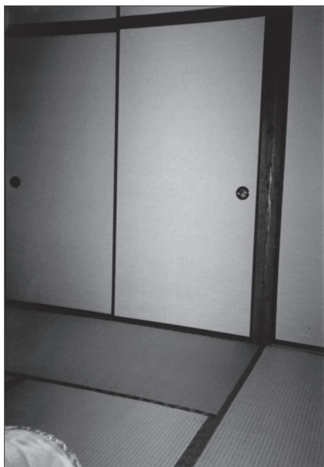
Slika 5: Fusuma – drsna vrata, ki delijo sobe.

Za razsvetljavo ponoči so najprej uporabljali sveče na železnih svečnikih. Sveče so bile narejene iz rastlinskega voska in s papirnatim stenjem. Najpogostejši prenosni svečnik se je imenoval te-sboku , bil je železen s tremi nogami in široko ploščo, kamor se je stekal vosek, in z obročem, ki je držal svečo. Fosforne vžigalice so prišle v uporabo šele v meijskem obdobju, do takrat pa so uporabljali kresilne kamne [Kashiwaki 2002: 32–41]. Pozneje so začeli sveče in posodice z oljem zakrivati s papirjem in tako je nastal andon . Andon je