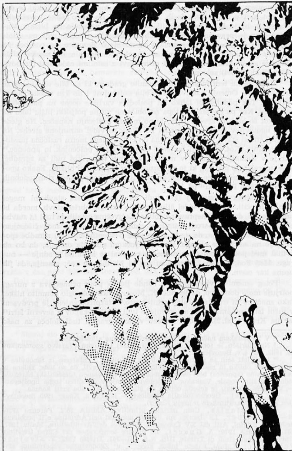
Sl. 1: Razprostranjenost kamnitih hišk v Istri (Po T. Stepinac — Fabijanić, Paleo-etnološka istraživanja kamenih poljskih kućica okruglog tlorisa). Dopolnjeno: 1 — Bezovica, 2 — Tinjan, 3 — Podpeč—Zanigrad.