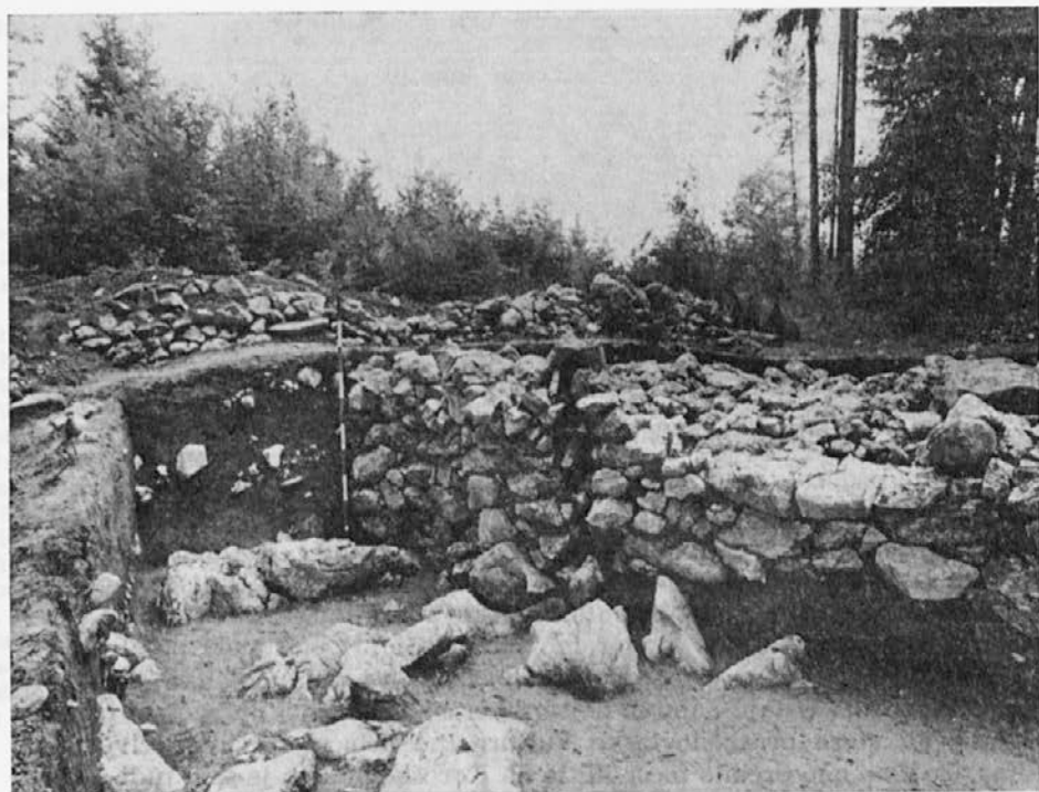
Stična. Pogled na obzidje železnodobne naselbine.

naleteli tudi še na staro prebivalstvo je prav tako verjetno. V tem smislu je prazgodovinska železna doba pogojevala slovenske naselitev. Kot je ugotovil že M. Kos: naselitvena in kulturna pokrajina, kot nam jo ponazarja arheološka karta pred-slovenske dobe, se presenetljivo krije navadno z obsegom starejšega naselitvenega področja. Ali z drugimi besedami: Slovenec se je naselil prvenstveno tja, kjer je našel že za kulturo pridobljeno zemljo, odprt, močno iztrebljen ali pa z gozdom le slabo porasel svet. S tega vidika bomo tudi razumeli, da so v bližini starih halštatskih postojank nastale prve slovenske organizacijske enote, prafare ali samostani. Naštejem naj le izbor imen z Dolenjske: Stična, Šentvid pri Stični in pri Ljubljani, Trebnje, Smarje, Mokronog, Bela cerkev, Novo mesto, Šentjernej, Sv. Križ pri Kostanjevici. Mnoga imena so razumljiva le, če poznamo prazgodovinsko naselitev!