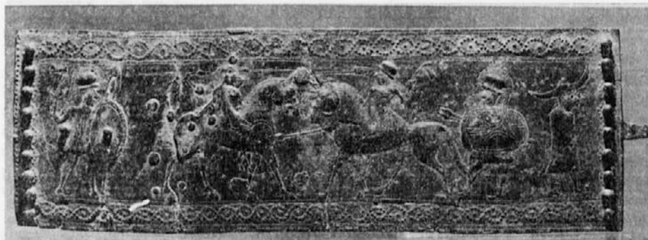
Vače. Bronasta opasna spona.

vali, o poganih, ajdih in njihovih svetiščih. Smo pa ta spomin kultivirali na drugačen način. Svetišča ajdov smo pokristjanili s stotinami cerkva in cerkvic na naših hribih, ki leže tako pogosto v starih halštatskih naseljih. S tem smo ustvarili tudi tipično slovensko pokrajino, arhitekturo, dali pokrajini podobo, za katero se moramo zahvaliti stari halštatski poselitvi.