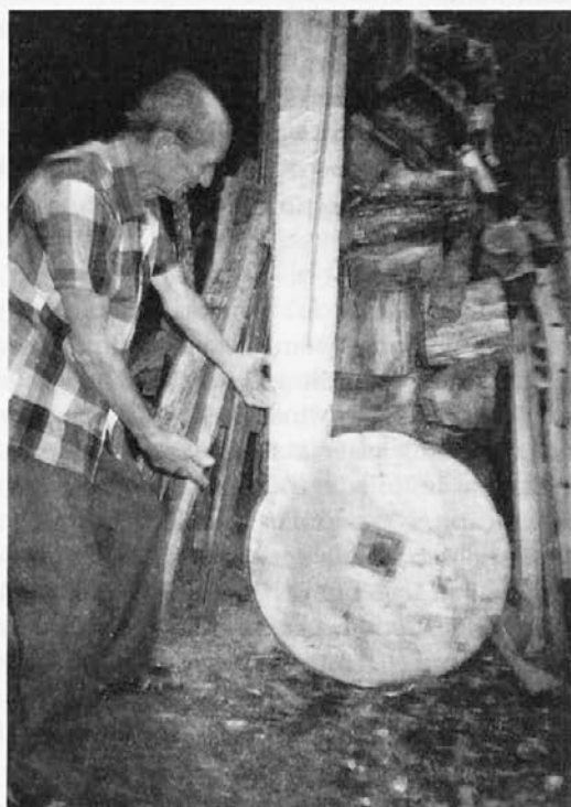
Kamen za tretje sadja - Kamen za tretje sadja imajo pri Gladovih še vedno, a ga že več let ne uporabljajo in leži zametan pri drveh. Zdaj sadje meljejo že z mlinom.