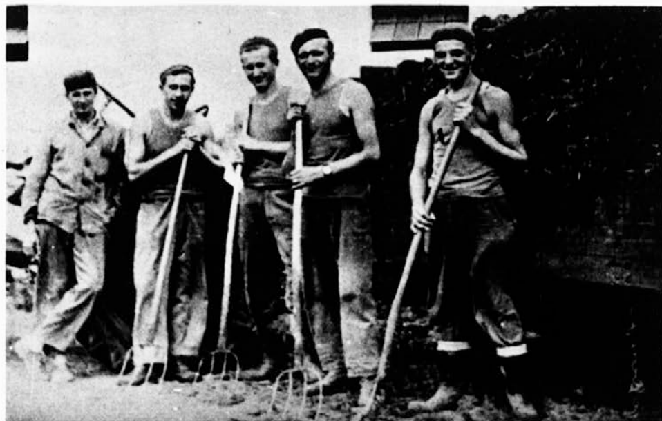
Skupina sezonskih delavcev z Gornjega Senika v Kószegu leta 1953, pri nakladanju gnoja. (Reprodukcija, original pri Jánosu Csuku, roj. 1915, Gornji Senik, upokojenec.)