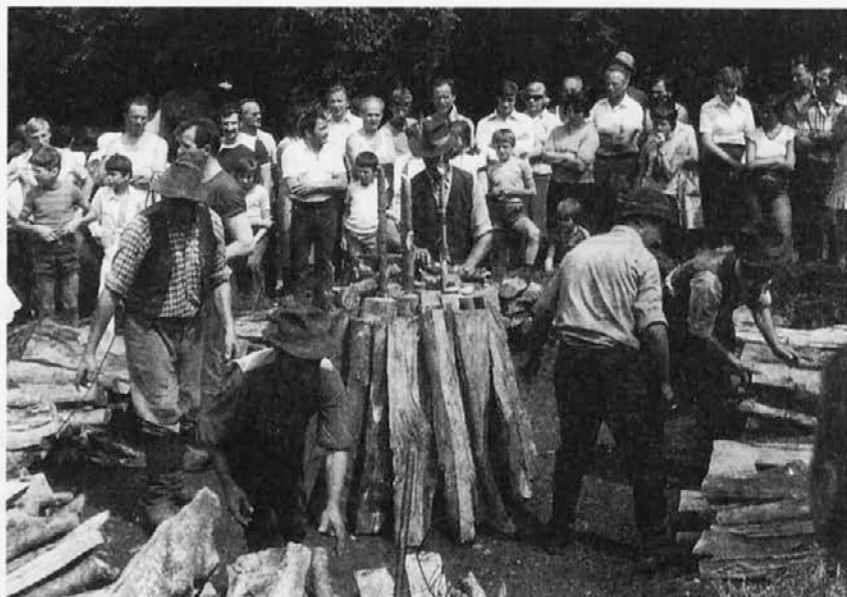
Drva, naložena v krog okrog kopišča, koparji zlagajo v kopo; v sredini so vidne strženice

300–800 kg oglja in je vsako kopišče izčrpavalo 3–5 oralov gozda, so nastajala kopišča tudi v gozdovih Selške in Poljanske doline. V 16. stoletju so se pojavile fužine tudi ob Hobovščici in v 17. stoletju še ob Volaščici v Poljanski dolini. Za te fužine so žgali oglje predvsem na Blegošu. Ob koncu 17. stoletja so sicer poljanske fužine propadle, a potrebe po oglju so bile še velike in koparjenje se je razvilo tudi okrog Mladega (1374 m) in Starega vrha (1217 m), močno poraslih z listavci in iglavci. Ker so koparji ogrožali gozdove, so bila stalna trenja s kmeti; tako so v Martinj Vrh leta 1718 kmetje koparju razdrli kopo 4 . Ko je cesarica Marija Terezija uvedla splošno vojaško obveznost, so bili vsi delavci, povezani z delom fužin, oproščeni vojaške službe. Žal je bilo z nastopom Napoleona proti Avstriji tega privilegija konec, tudi za koparje.