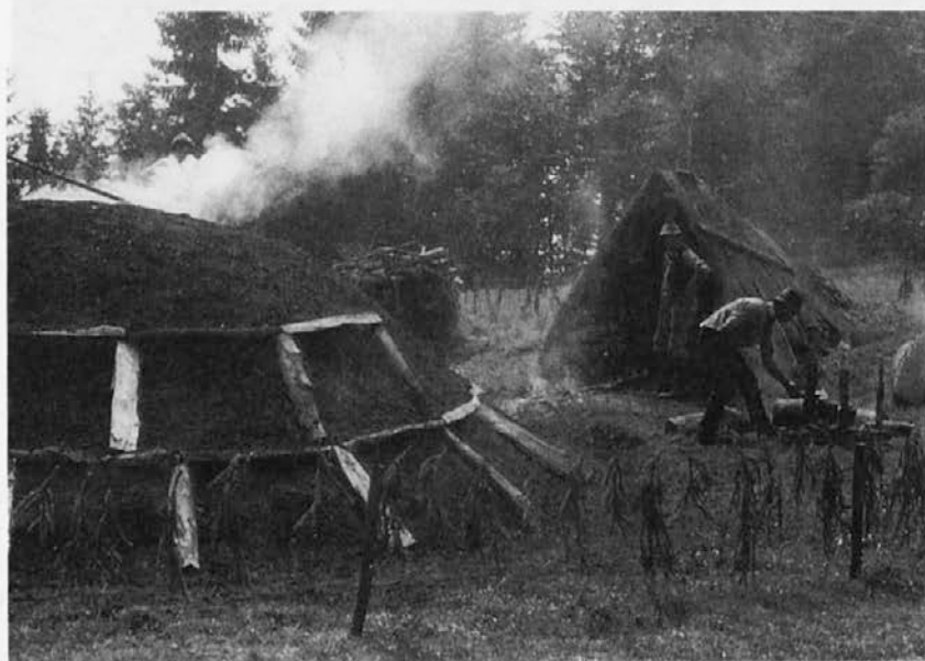
Če prst drsi, je treba dodati še eno vrsto -polic- ; desno je en kopar v koparski bajti, drugi pa pri ognjišču

h kopišču in jih zlagali v krogu okrog njega. Kot nekdanj vsako delo, je bilo treba tudi to začeti z božjim žegnomo, sicer ne bo sreče pri kuhanju kope. Ravno v sredino kopišča je treba položiti dve poleni v obliki križa. Koparji, ki so veliko kuhali, so imeli celo iz železa narejen križec za trajnejšo rabo. Votla sredina kope staržen se naredi tako, da se zabijejo v sredino okrog 8 čevljev dolgi koli starženice . Nanje je treba z dratom privezati dva rôča z dober čevljev širokim premerom, narejena iz beke ali sroboti; enega na sredi in enega na vrhu kolov. Potem se okrog stržena postavljajo pokonci drva v dveh štosih ; da se vrh kope lepo zaokroži, je treba iz karbinov (kosov nezgorelih drv prejšnje kope) narediti glavo . Potem je strmi del kope treba obgrasat , obložiti s smrekovimi vejami, vrhnji položni del pa navadno kar s praprotjo. Na graso je treba nametati pol čevlja na debelo prsti, ki je bila že žgana. Če prst še ni bila žgana, je potrebna debelejša plast. Tako je kopa postavljena in pripravljena za kuhanje.