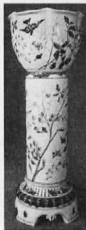
Žardinjera. Konec 19. stoletja.

Olomouški izdelki so ustrezali svoji dobi in spodbujali proizvodnjo tudi v podobnih podjetjih. Na izdelkih lahko ugotovljamo podobnosti med češkimi in moravskimi manufakturami. Približno v istem času so namreč delovale delavnice v Staré Role, Tyncu nad Sázavou, v Dalovicah in v Českých Budějovicah (Hardtmuth), v Vranovem nad Dyjí in v Znojmu. Osrednji motivi teh posod so bila morska nabrežja, gorski in alpski svet, letni dvorci v različnih letoviščih, gradovi in njihove razvaline in razna svetišča. Olomouške izdelke pa krasijo zgodovinske stavbe (Karlštejn, Bezdez), ki so jih imele v svojem programu tudi druge delavnice. V Vranovem npr. pa so morali zaposleni dolbsti v kovinske plošče svoje lastne motive ali pa so kopirali tuje vzorce. Lahko pa domnevamo, da je bilo del predlog skupnih obema podjetjema, v Olomoucu in Vranovem. Po ohranjenih izdelkih lahko sklepamo, da je v starejšem obdobju družine Schütz pomembno mesto v dekoraciji zavzemala nabožna tematika. Prikazana so romarska mesta in svet-