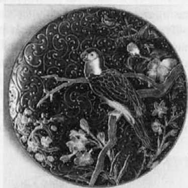
Stenski krožnik s papigo. Konec 19. stoletja. MO

Sicer pa se na t. i. ljudski keramiki uveljavlja okrasje dveh vrst. Eno krasi olomouške izdelke najstarejšega obdobja - to je kombinacija listov in plodov vinske trte - in je značilno za ploščato posodje, za skodelice z dvojnimi ročajem in za vrče. Na nekaterih ohranjenih krožnikih opazimo oznako z poimenovanjem kraja izdelave in V. Šujan jih uvršča še pred leto 1859, ko je bila družba Schütz formalno ustanovljena. Drugi okras, ki se pojavlja na še bolj raznovrstnih keramičnih izdelkih, je motiv vrtnice in ivanjščice, redkeje imamo tudi košarice s sadjem. Dna krožnikov so včasih okrašena tudi z motivom ptička. Stranice krožnikov pa po navadi krasijo lističi in drobni cvetovi. Poslikane površine so omejene z barvnimi črtami. Za obe vrsti motivov so značilne živopisane barve - vrtnice so vedno živordeče, uporabljena pa je še rumena, opečnatordeča, jasnomodra, živozelena in temnorjava. Obe vrsti motivov sta tudi popolnoma standardizirani. Razlike so le v kvaliteti izvedbe - ta izdaja okraševalčevu spretnost in obdobje izdelave. Poznejšo fazo proizvodnje označujejo malomarnejshe poslikave in preveč kričeče barve.