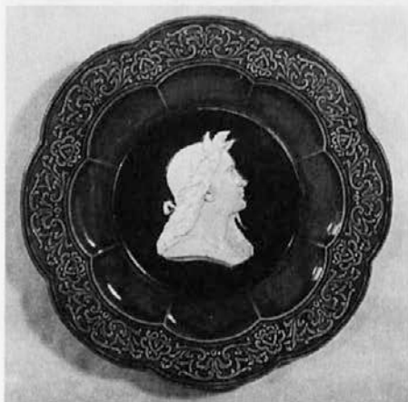
Stenski krožnik v renesančnem stilu. Zadnja tretjina 19. stoletja. Muzej olomouške keramike v Olomoučanah (dalje MO)

nobenh poročil, zato si je tudi težko predstavljati, kako je bila razporejena po zgradbah. Olomouška tovarna je bila, sodeč po njenih izdelkih, v tistih razmerah obravnava kot povprečno podjetje. Njeno proizvodno vsebino so usmerjale potrebe kupcev iz širokih nižjih in meščanskih krogov. Posledica tega so bili seveda izdelki za povprečen okus. Predstavitev olomouških izdelkov zaradi pomanjkanja pisnih virov ne sega na same začetke proizvodnje, ki je bila povezana z Lenkom in Selbom. Wanklovo dokazno gradivo pa se omejuje samo na navadno kuhinjsko posodo in na drugo belo glazirano posodo. Najstarejši ohranjeni izdelki so še iz časa, ko so delavnico prevzeli Schützi. Glede na vrsto naročil se je tudi oblikovanje izdelkov kmalu razdelilo na dve področji, ki sta se vzporedno razvijali. Tako je glavno dejavnost olomouškega podjetja predstavljala t. i. ljudska keramika, ki je bila v proizvodnem registru že od samih začetkov. V sedemdesetih letih pa so bili tem izdelkom dodani še modni izdelki, ki so s svojo umetnoobrotnim videzom sledili trenutnim trendom. Seveda pa so prevladovali izdelki za široke ljudske mase, za katere je bil porcelan nedosegljiv. To so bile bele posode z živopisanim cvetjem, ki so predstavljale proizvodnjo večine keramičnih manufaktur okoli polovice 19. stoletja.