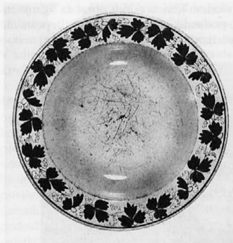
Globoki krožnik z motivom vinske trte. Šestdeseta in sedemdeseta leta 19. stoletja. Etnografski zavod moravskega deželnege muzeja v Brnu