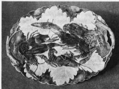
Skleda z raki. Konec 19. stoletja. MO

Najobsežnejša izdelava »kmečkega« posodja je segla tudi na začetek 20. stoletja. Na trajnost tovrstne proizvodnje je vplivala priljubljenost med porabniki. Izdelki so namreč upoštevali tradicionalne oblike, ki so imele najpogosteje samo okrasni namen. Poleg oblik, ki izhajajo iz ljudstva (npr. nočna posoda, latvice, vrči, vsa osnovna ploščata posoda), se pojavljajo tudi kavni in čajni servisi, skledice za juho, omačnice, škatlice, čaše, pepelniki ipd. Čeprav je okrasje na njih podobno, njihove oblike izražajo stile različnih obdobj.