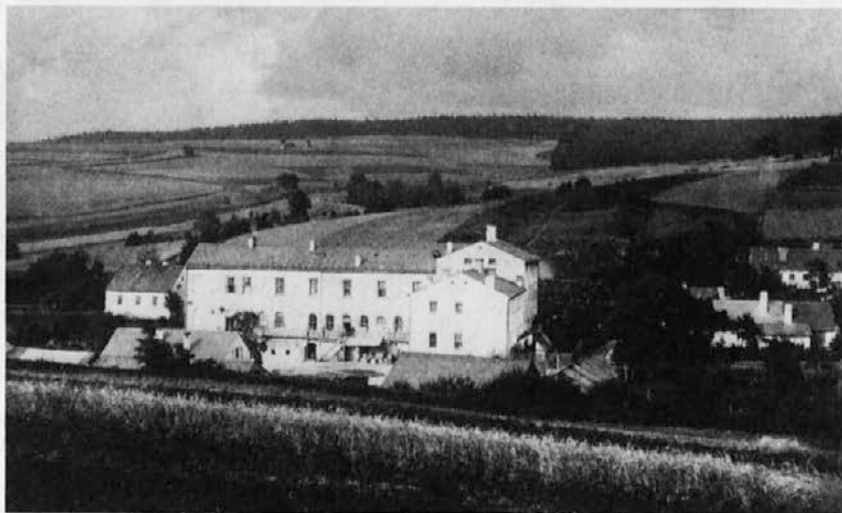
Tovarna za uporabno keramiko na jugu olomouškega področja. Stanje pred 1. svetovno vojno