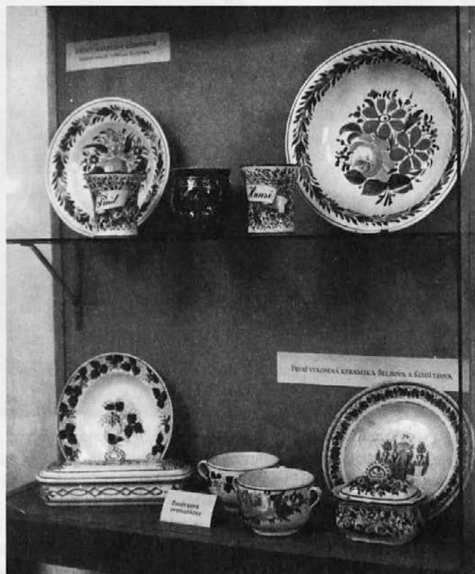
Pogled na vitrino s kmečkim posodjem v Muzeju olomouške keramike v Olomoučanih (po letu 1960)

Olomouška keramika je bila zaradi svojih belih črepinj poimenovana tudi kot belina . Glede na tehnološko gledišče ni bilo razlik v proizvodnem postopku sorodnih manufaktur, pa tudi ilovica in druge primesi so bile pripeljane iz istega vira. Oblikovali so z vrtečim vretenom, poleg tega se je odlivalo tudi v mavčne oblike ali pa stiskalo. Pri t. i. kmečki keramiki so po prvem žganju izdelek polili z redko maso, sledilo je drugo žganje in površinsko okrasje, potem pa še zadnji »žegen« v peči. Delovni proces posameznih izdelkov je popisal V. Šujan. Prva dva zgoraj omenjena postopka je nadomestilo t. i. okrasje pod loščem ali glazuro. Pri tem se je še surova površina ali t. i. biskvit premazala z vodnimi barvami, pokrila s tanko plastjo voska in zunaj ter znotraj prelila z glazuro. Pri nadaljnjem žganju se je vosek stopil, tako da se je glazura spojila z barvami, in posoda je dobila visoki lesk.