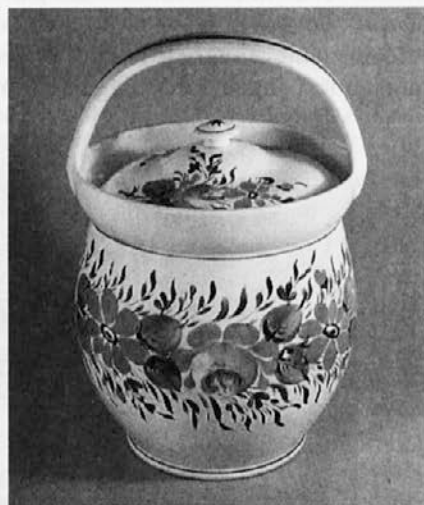
Kotni lonček z živopisnim cvetnim okrasjem. Konec 19. stoletja. EU MZM