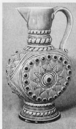
Vrč v stilu porenske keramike. Zadnja četrtna 19. stoletja. MO

Povečevala se je tudi težnja po zvišanju estetske privlačnosti izdelkom, ki so bili namenjeni vsakdanjim potrebam. Obsežen izbor zajema predmete z izvirnim okrasjem kot so npr. stenski krožniki, keramične imitacije lovskih trofej, reliefne krajinske slike, okvirji za slike; servisi za pitje in jedilni servisi, posamezni vrči, poliči, maseljci, bokali, sklede, pribori za umivanje, različne vaze, široke posode za cvetje, cvetlični lončki, posode za dežnike, doze raznih velikosti, svečniki, pepelniki, črnilniki, otroški hranilniki, zvončki, kropilniki in tablice s hišnimi številkami.