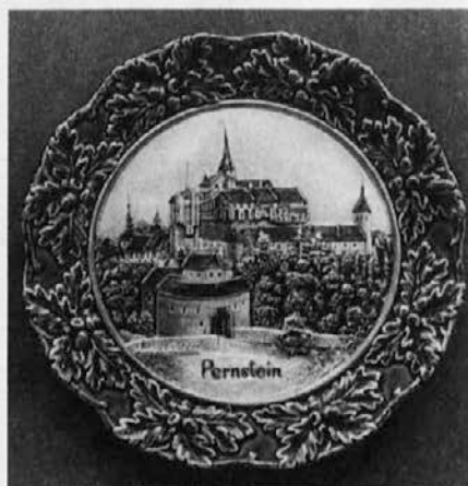
Stenski krožnik z motivom gradu (Pernštejn). Konec 19. stoletja

Sledilo je krajše obdobje, iz katerega so se ohranili primerki ploščate posode (večinoma krožniki in skledе) s črnim rutinskim okrasjem in s svetimi podobami na dneh kot so npr. sv. Janez, sv. Katarina, sv. Klara, Marija z Jezusom ipd. ali pa upodobitve znanih romarskih cerkva (v mestih kot Krtiny, Sloup, Hostyn Mariazell). Nemški napisi ob njih še natančneje določajo svete figurice in romarska mesta. Krajinske podobe pa predstavljajo znana češka mesta kot Bezdez, Karlštejn, Kokořín. Posoda je praviloma obrobljena z zlatorumeno in rdečerjavo črto ali z modro. Včasih pa obrobje posod krasi stilizirani motiv vinske trte ali pa pet drobnih krajinskih motivov, ki so še dodatno okrašeni s svetimi podobami ali z rokokojskimi otroškimi podobami. Ponekod so alegorizirane podobe mesecev in letnih časov. Ohranjenih je tudi nekaj globokih skled za juho, kropilnikov, čaš in kup. Posode, ki spominjajo na neke vrste porcelana in so jih sočasno izdelovali v več podjetjih, so se pojavljale najprej v prvi tretjini 19. stoletja, na koncu petdesetih in potem še v sedemdesetih letih.