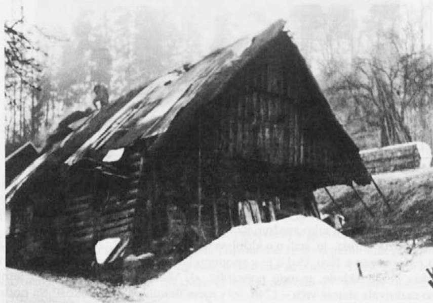
Sl. 1: Lesena hiša iz 17. stoletja. Selo pri Utiku (foto: Branko Sršen 1990).

Ko sem pred nedavnim prepisoval stare terenske zapiske, sem v enem naletel na vabljev, a popolnoma pozabljen zapis o leseni kmečki hiši iz srede 17. stoletja. Hiša mi je sicer ostala v živem, dasi ne oblikovno natančnem spominu, pozabil pa sem, da sem si njeno situacijo tudi zasilno skiciral in dodal še par vrst popisa. Te najdbe sem se kar razveselil, saj se mi vzbuja vprašanje, koliko takih in tako starih objektov se še skriva na naših tleh. Bojim se, da je bila omenjena lesenjača ena zadnjih svoje vrste in časa pri nas.