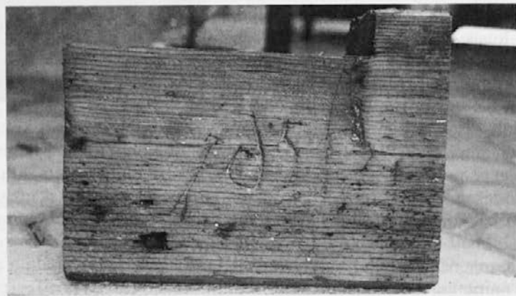
Sl. 3: Tram – »glajt« z vrezano letnico.