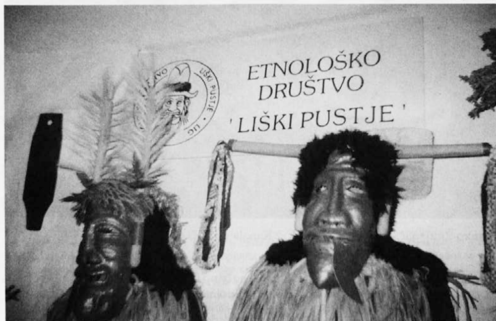
Ta pšenični (levo), ramáuš (desno)