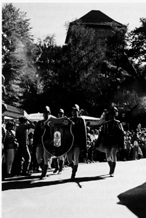
Meščanska zavest, vezana na oddaljeno zgodovino mesta, danes v preoblikovani podobi živi le še na simbolni ravni. – /Začetek spreveda ob Dnevih narodnih noš leta 1995/

Kamnik ob ponovni vzpostavitvi večstrankarskega sistema torej ni bil več stari Kamnik, ki je imel svoje središče in svoje obrobje, svojo elito in svoje družbeno dno. Meščanska zavest je bila samo eno od občutij pripadnosti mestu, ki so mu prizadevanja posameznikov »za korist mesta« postala enakovredna. O Kamniku z enakim ponosom govorijo meščani in okoličani, domačini in priseljenci. Prav meščanska zavest pa se je ob novih družbenih spremembah izkazala za ljubosumno varuhinjo nekdanje elite; povzročala je individualne spore med tistimi meščani, ki so se kljub nekdanjim socialnim razločkom v času socializma povezali. Pripadniki nekdanjega družbenega sloja so tiste, ki pred drugo svetovno vojno tja niso sodili, ponovno gledali drugače: » On ni kamniški meščan. Kakšen kamniški meščan! Nikol ni plesov – plesat ne zna! Nikol ni plavov – plavat ne zna! «