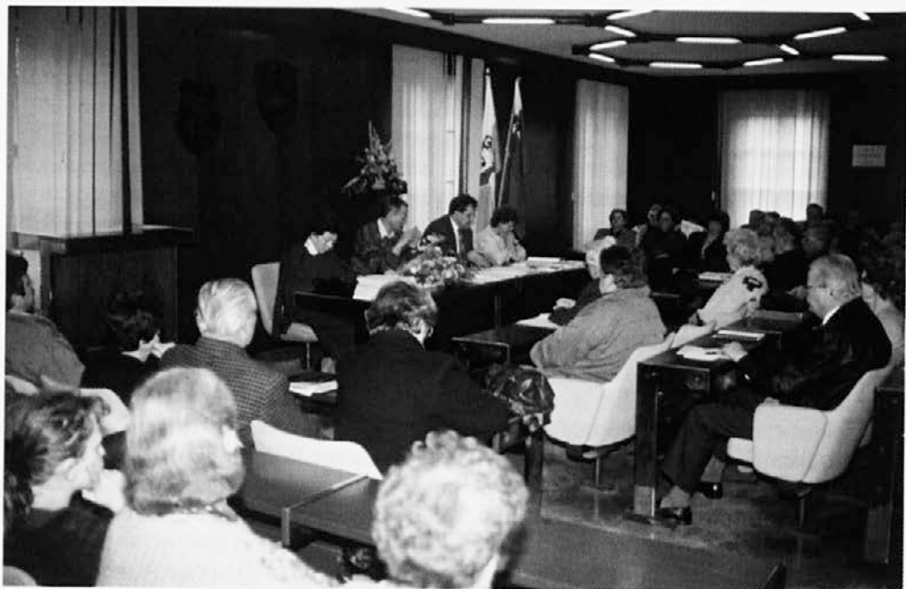
Probleme meščanske zavesti in vračanja premoženja je v devetdesetih letih odprla ponovna ustanovitev Meščanske korporacije Kamnik. – /Občni zbor Meščanske korporacije Kamnik leta 1994/