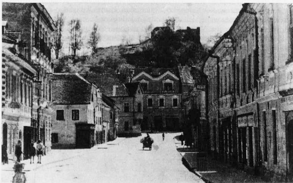
Simbolu kamniškega meščanskega ponosa in meščanske zavesti, stavbi Narodne čitalnice, so Nemci med drugo svetovno vojno dali nemški videz. – /Glavni trg v Kamniku med drugo svetovno vojno; izvirnik last Petra Klavčiča, Kamnik/

Navzven je Kamnik med drugo svetovno vojno ohranil središčno vlogo. S spremembami železniškega omrežja je bila omogočena celo neposredna zveza z Dunajem. Zaradi urejene zunanje podobe so Nemci Kamnik primerjali z nemškimi mesti. «Mušter za celo Evropo je biv Kamänk!» 12 Mesto so predvsem komunalno urejali tudi Nemci sami. 13 S takšnimi ukrepi so pridobili simpatije nekaterih meščanov, medtem ko se je v nacionalnem odporu vedno bolj izražal tudi razredni boj.