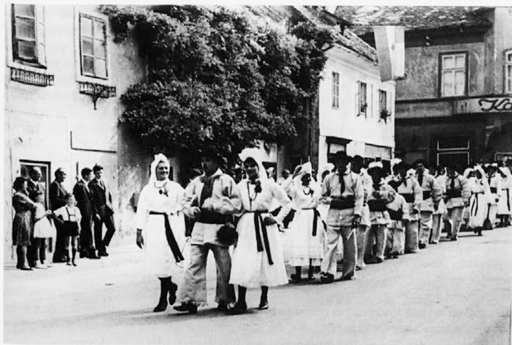
Dnevi narodnih noš so meščanom pomenili prikrto manifestacijo meščanske zavesti, priseljencem pa preoblikovan spomin na dom. – /Dan narodne noše leta 1966; arhiv Turističnega društva Kamnik/

V teh razmerah pa si je tista skupina meščanov, ki so bili nosilci predvojnega javnega življenja, še vedno prizadevala, da bi obnovila sloves mesta z odmevnimi dejavnostmi. Za to sta bila poleg športa in kulture v ožjem pomenu besede politično sprejemljiva turizem in folklor. Leta 1966 je Turistično društvo Kamnik zasnovalo prireditev Dnevi narodnih noš, ki je kmalu postala najpomembnejša kamniška prireditev in njegov identifikacijski simbol. Povojna leta so močno spremenila odnos do izročila, tako do kmečkega kot do meščanskega. »Narodna noša« je pomenila oboje: 29 meščanom je praznik narodne noše pomenil skrito manifestacijo nekdanje meščanske zavesti, priseljencem pa je nudil domačnost, ki so jo pustili doma.