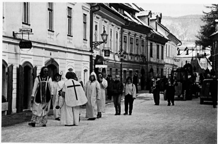
Večplastni problem izumiranja mestnih središč, v Kamniku najbolj viden v zaprtem delu mesta, izraža veliko spremembo zavesti meščanov in okoličanov. Mesto živahneje zaživi le še ob prireditvah, ki pa so nekdanjim meščanom tuje. – /Mladina iz Tunjic ob -pokopavanju pusta- v Kamniku na Šutni na pepelnično sredo leta 1994; foto M. Klobčar/