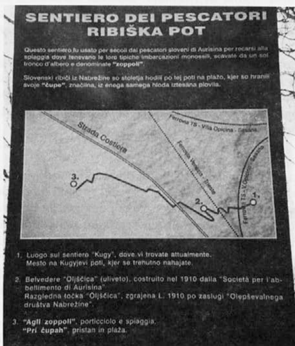
Na vrhu kraške planote. – Foto Lisjak 1998

Vasi so nastale visoko na robu kraške planote, ker tik ob morju ni bilo primerno širokega prostora in mimooidnih cest. Zaradi tega so bili ribiči prisiljeni pešačiti iz vasi do morja, kjer so hranili svoja plovila in potrebščine v obmorskih hišicah. Tako so nastale ribiške poti, ki so povezovalle morje z vasi Kontovel, Križ in Nabrežina. Njihova dolžina se je sukala od enega do dveh kilometrov in glede na to, da so skušali izbrati najkrajšo razdaljo čez strm skalnat rob, je bilo v njih vključenih tudi od 400 do 500 stopnic. Take poti so bile štiri, vsaka vas je imela po eno, Kontovel pa dve, eno proti Miramarskemu gradu v Grljan in drugo proti Trstu v Čedaz. Vse so bile v rabi in lepo prehodne do druge italijanske zasedbe našega ozemlja leta 1954, ko je ribištvo začelo postopoma propadati in se je začelo programirano raznarodovanje naše obale.