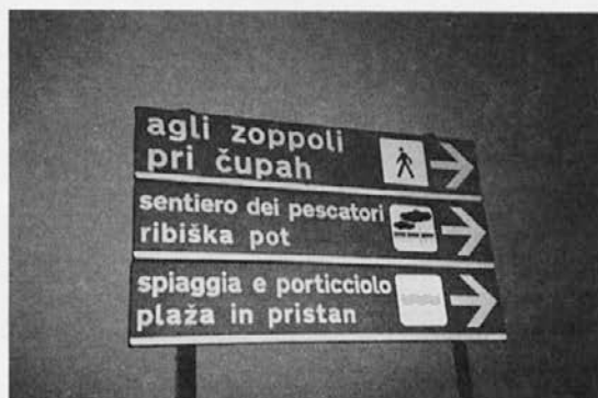
Na državni obalni cesti – Foto Lisjak 1998

Razgled je veličasten, verjetno najlepši v celem Tržaškem zalivu. Se spleča ostati tu nekaj trenutkov in se naužiti lepote še nepokvarjene narave.