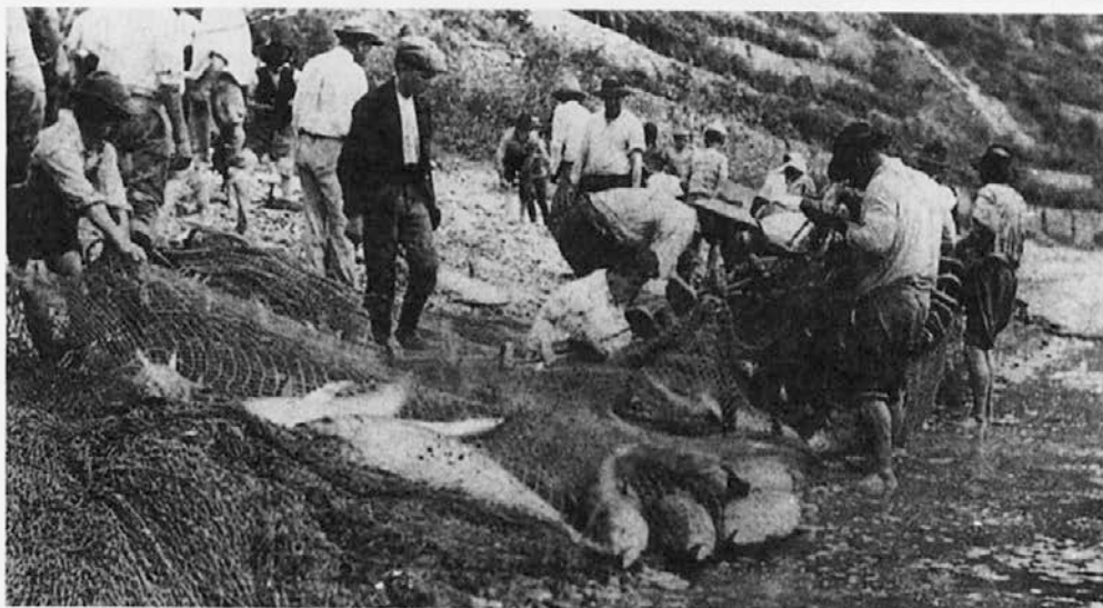
Najstarejši posnetek tonolova pred 1. svetovno vojno. Ribiči imajo dolge spodnje hlače zavahane do kolen