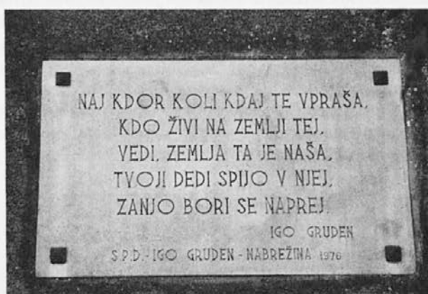
Plošča z verzí Iga Grudna. – Foto Lisjak 1998

In prav ta zadnja kitica je vklesana na kamniti plošči na zidu stopnic ribiške poti pri morju v trajen opomin, da ... zemlja ta je naša, tvoji dedi spijo v njej, zanjo bori se naprej!