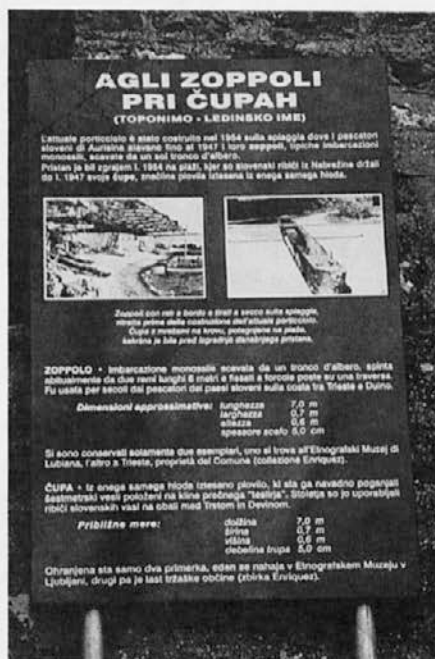
Pri morju na obali. – Foto Lisjak 1998

Mislím, da mu moramo biti danes res hvaležni.