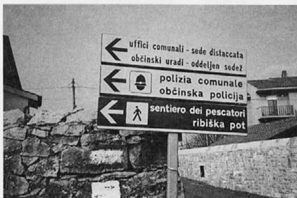
Na pokrajinski cesti.