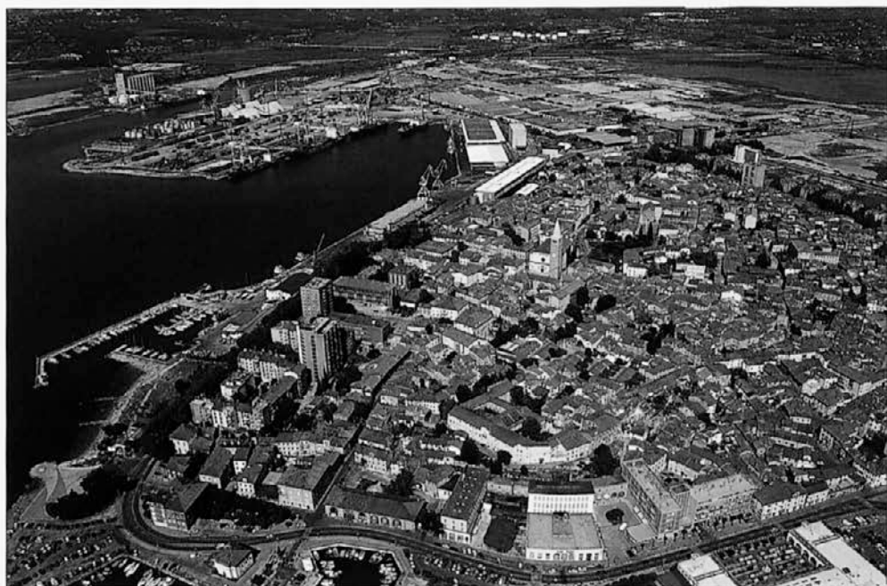
Slika 5: Mesto Koper z značilnim starim sredozemskim jedrom leži na nekdanjem otoku. V ozadju je največje slovensko pristanišče.