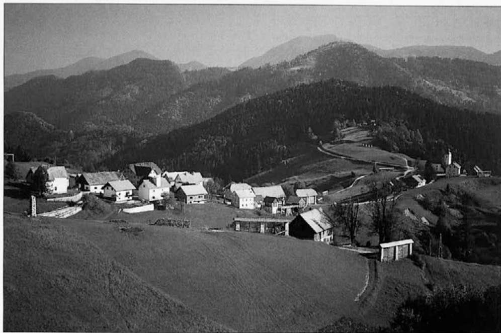
Slika 2: Sorica, razložena alpska vasica z več gručami hiš, kozolci in cerkvijo sv. Nikolaja leži na ledeniških nasipih v Škofjeloškem hribovju.