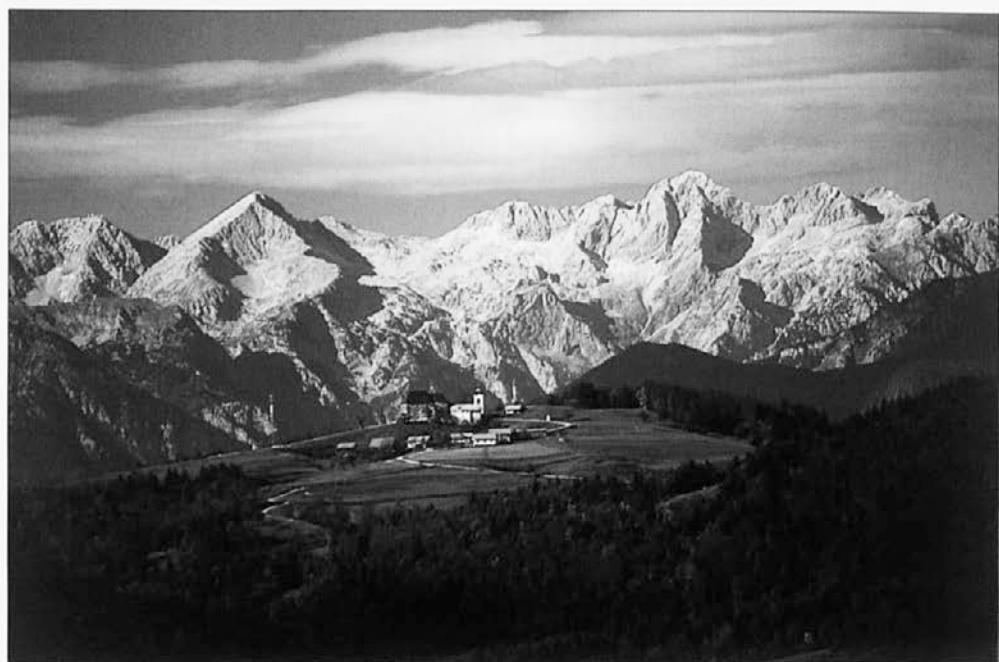
Slika 3: Limbarska gora z izpostavljenno cerkvijo sv. Valentina leži v zahodnem delu Posavskega hribovju. Sestavljajo jo razloženi zaselki. V ozadju so Kamniško-Savinjske Alpe.