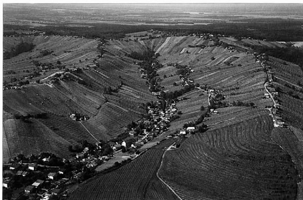
Slika 9: Lendavske gorice/Lendvahegy so razloženo naselje v istoimenskem gričevju ob meji z Madžarsko. Večina hiš stoji na slemenih, po pobočjih pa so vinogradi in njive.