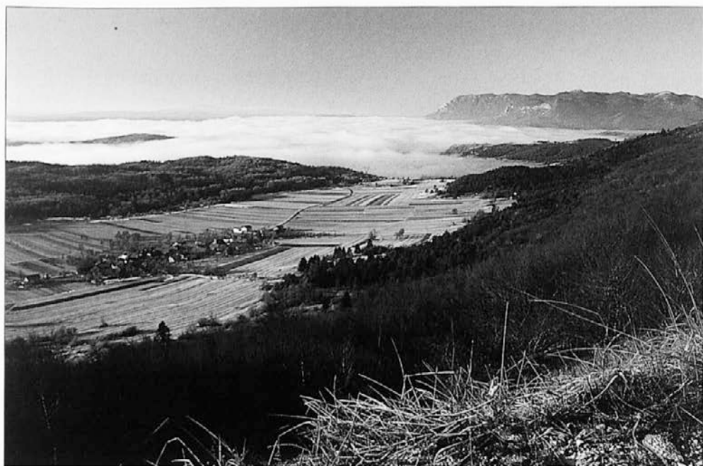
Slika 6: Strmca je gručasta dinarska vasica, ki leži pod kraško planoto Hrušico nad Pivškim podoljem.