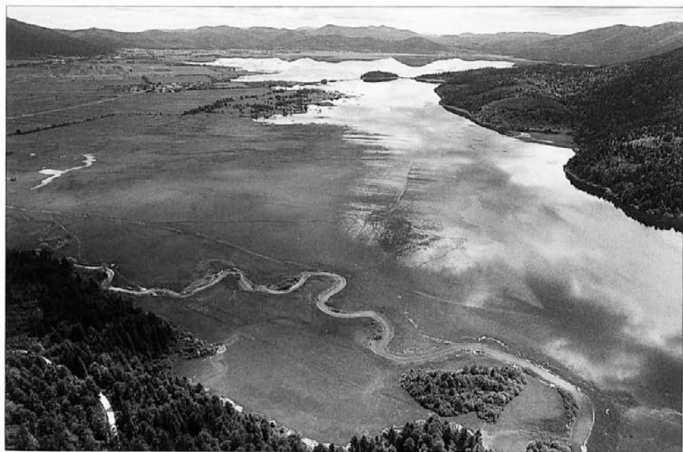
Slika 7: Znamenito presihajoče Cerknjansko jezero leži na kraškem Cerknjanskem polju v Notranjskem podolju.