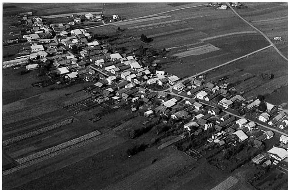
Slika 8: Dragonja vas je veliko obcestno panonsko ravninsko naselje sredi njiv na Dravski ravnini, v južnem delu Dravskega polja.