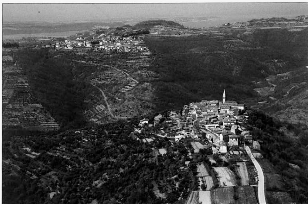
Slika 4: Padna je gručasta, tesno pozidana vasica, ki leži na pomolu ozkega slemena nad dolinama potokov Drnice in Piševca v Koprskih brdih. V ozadju se vidi Piranski zaliv.