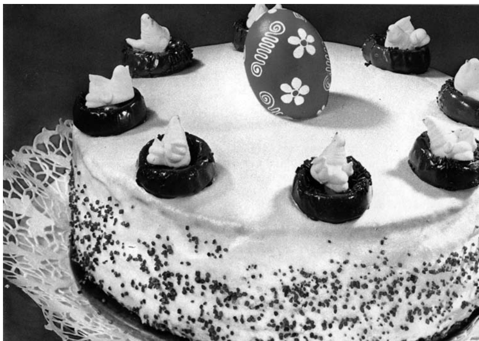
Ilustracija k receptu za pomladansko ( velikonočno , op. a.) torto, začetek 70. let 20. stoletja.

Mesne jedi so tudi pomembna sestavina velikonočnega kosila, ki se po sestavi ni dosti spremenilo od tistega, pripravljenega za veliko noč pred 2. svetovno vojno. Pri večini respondentov kosilo sestavljajo goveja ali kokošja juha z rezanci, kuhana govedina, pečena svinjina ali perutnina, pražen krompir, solata in orehova potica. Pri kosilu postrežejo tudi z vinom, ponekod celo s penečim vinom, kar je v velikonočnem obroku novost, ki se je uveljavila s prevzemom vzorca sestave prazničnih jedilnih obrokov za druge koledarske praznike. Starejše oblike sladkih pogač in peciva (npr. potica, kruhi, pletenke, ptički in menihi) so v nekaterih gospodinjstvih že nadomestile druge sladice, pogosto peciva, pripravljena iz biskvitnega testa z nadevi, in velikonočne torte.