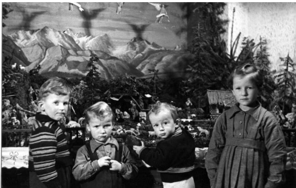
Otroci pred domačimi jasicami, Mengeš 1955.

Za božič so v mnogih slovenskih družinah pekli tudi sadni kruh – klecenbrot , pripravljen iz ržene moke in več vrst suhega sadja, na Štajerskem tudi bider iz finega testa z mlekom in smetano ter rozinami. Na Primorskem so pekli pinco in cvrli flancate – štraube . Mesne jedi so imele večji pomen na božič, na božični večer pa je bil tako kot že ves dan pred svetim večerom zapovedan post, ki so ga ljudje praviloma spoštovali. Imenovali so ga tudi veseli post zaradi pričakovanja Zveličarjevega rojstva [Kuret 1989: 326]. Pripravljali so različne postne jedi, predvsem juhe, močnike in stročnice, na Primorskem in v meščanskih gospodinjstvih pa so bile na božični mizi tudi jedi iz morskih ali sladkovodnih rib, predvsem polenovka – bakalar . Iz ohranjenega gradiva (Arhiv ISN ZRC SAZU) je moč razbrati, da so tudi v 50. letih 20. stoletja spoštovali post, zato so na ta dan pripravljali naslednje postne jedi: prežganko, krompirjevo juho, kuhano suho sadje, žgance, polenovko s polento, fižol, zelje, ohrovt, gibanice, štruklje in močnik. Na Dolenjskem so pripravili tudi kostanjev pire, zabeljen s kurjo mastjo, na Primorskem pa joto. 5 Postne jedi so bile pred 2. svetovno vojno na mizi tudi v premožnih plemiških in meščanskih družinah. Zlasti so bile razširjene sladkovodne ribe, ki so bile tudi pri nas, podobno kot drugod po Evropi, značilna božična postna jed. Božični večer v plemiški družini Wambolt von Umstadt z gradu Hmelnjik je opisan takole: