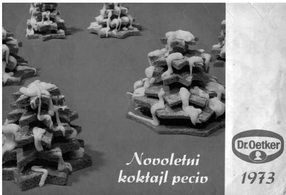
Zbirka receptov za novoletno pecivo, Dr. Oetker, 1973.