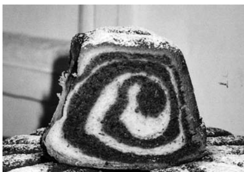
Orehova potica, Štajerska 2000.

V zadnjih dveh desetletjih, ko je praznovanje božiča znova oživel, so se kot pomembnejša sestavina tega praznika uveljavile zlasti božične večerje, manj pomembna so božična kosila. Pod vplivom sestave božičnih večerij v nekaterih zahodnih državah, predvsem Združenih državah Amerike in v Angliji, je tudi pri nas postala priljubljena priprava pečenega purana, pa tudi domačih narezkov in narezkov iz kupljenih suhih mesnin, npr. pršuta in salam. Pogosto poleg postrežejo še francosko solato, vložene kumarice in olive. Na podeželju se na dan pred božičem še postijo, vendar v manjši meri. Za večerjo pripravijo govejo juho z rezanci, pečeno kokoš ali ocvrtega piščanca, svinjsko pečenko, krompir in solato. Na koncu so priljubljene potice, predvsem orehova, makova ali smetanova z rozinami.