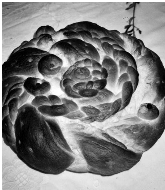
Velikonočna pogača, Podravje 2002.

O obveznosti, pomenu in pripravi velikonočne šunke v sodobnem praznovanju velike noči pričajo tudi odgovori izpraševancev na vprašalnik o spremembah praznične prehrane. 1