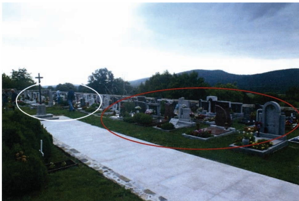
Sl. 2: Enaka struktura vasi je prepoznavna tudi v vaškem pokopališču, kjer so ob vhodu najprej grobovi Podluze, za njimi Ulčarjev, potem Plajnerja in na koncu Babenskega kraja. Tako kakor potok deli vas, deli križ na pokopališču vas na dva osnovna dela.

Rodik se zdi na prvi pogled enkraten zaradi tolikernih načinov, ki izražajo dvodelno strukturo vasi, na katero se naslanja nadaljnja delitev. Vendar je mogoče posamična primerljiva naselja najti tudi drugod na slovenskem območju, kompleksnejše izraze delitve naselij – tako v šegah in navadah kot v drugem izročilu – pa najdemo tudi drugod po Evropi in svetu.