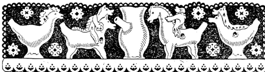
Slika 5. Ilustracija Hinka Smrekarja, lončenih dolenjevaških figur iz Ribniške doline (Fran Milčinski, Süha roba . Ljubljana 1920).

Ribničanov in motive njihove materialne kulture. Med ilustracijami izstopata lončeni figuri jahačev, levi lik močno spominja na volčji ali pasjeglavi lik, ki jaha konja.