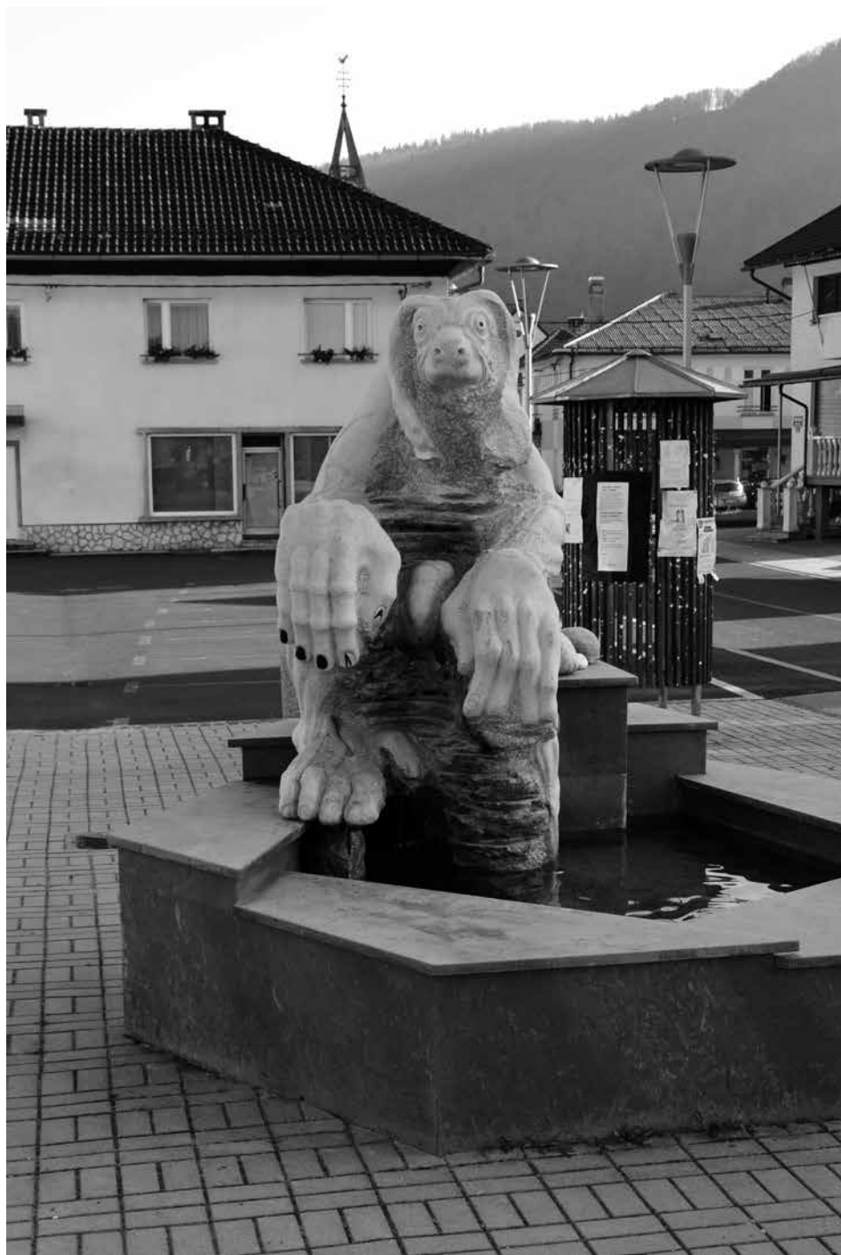
Slika 1. Kip pasjeglavca v Sodražici.