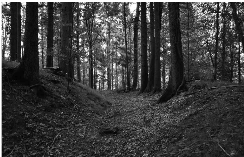
Slika 4. Lepo ohranjen obrambni jarek Starega gradu.

in kako je napadal ljudi na samoči, jim jemal denar in jih nekatere tudi ubil. Sadržan pa mu je pripovedoval o svojem življenju in kako so se stepli v gostilni ter da je prišel zato v ječo. Med drugimi razgovori mu izda razbojnik še eno svojih skrivnosti, kako je s tovariši zakopal veliko premoženje tamkaj nad Zamostcem pod hruško, v neki ogradi, med dvema gozdničema. Dandanes imenuje to ogrado Neukretnova, Veselova ograda, gozdnič na vrhu pa Kobilji dol.