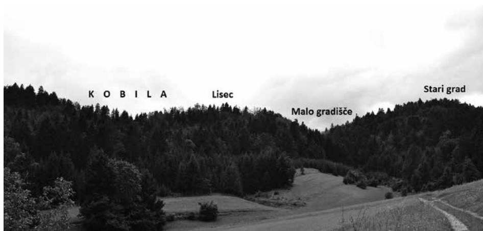
Slika 2. Trohrib Kobila z gradišči z vzhoda.