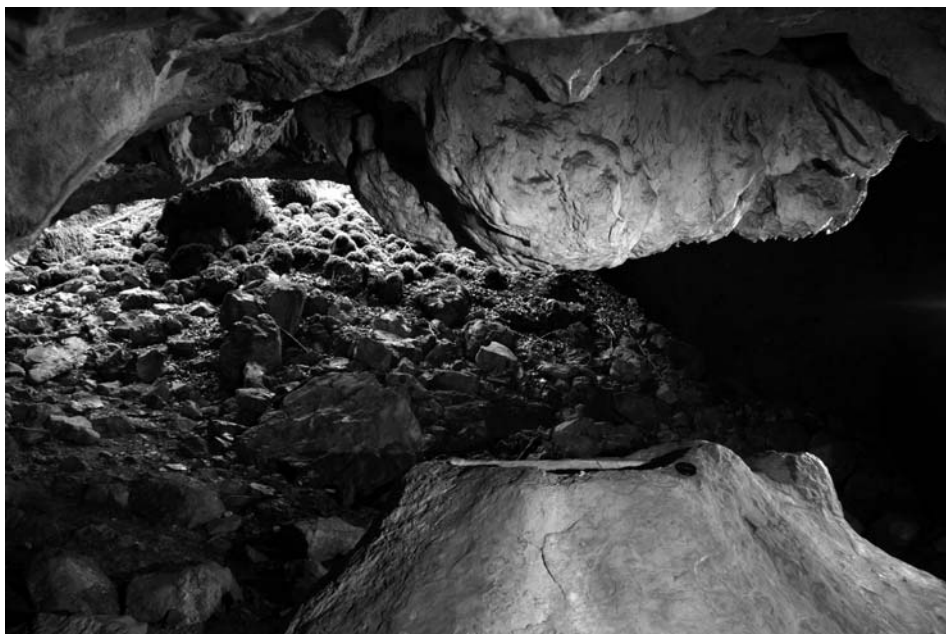
Sl. 4 Enako kot na sl. 3. Pogled s strani. Fig. 4 The same as on picture 3. Side view.