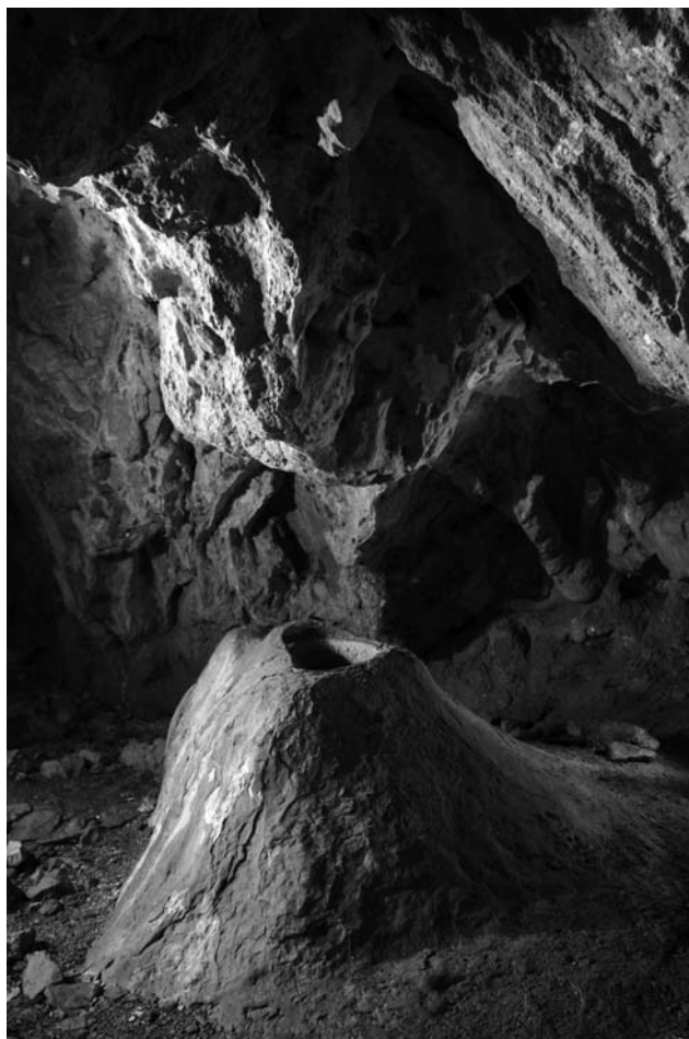
Sl. 3. Stalagmitna in stalaktitna tvorba, simbola vulve – devača in penisa – devač: 1. ali dve »skali« kot animistična objekta, 2. ali simbola dveh bajeslovnih bitij. V Čokovem članku (2010) je stalagmitna tvorba – vulva predstavljena kot obredni kamen s škovnico.

Fig. 3 Stalagmite and stalactite formations: symbols of vulva– devača and penis – devač: 1. Or two »rocks« as animistic objects, 2. or symbols of mythological beings. Čok's article (2010) presents the stalagmite formation-vulva as a ritual rock with a cup-like microkarstic formation called škovnica.