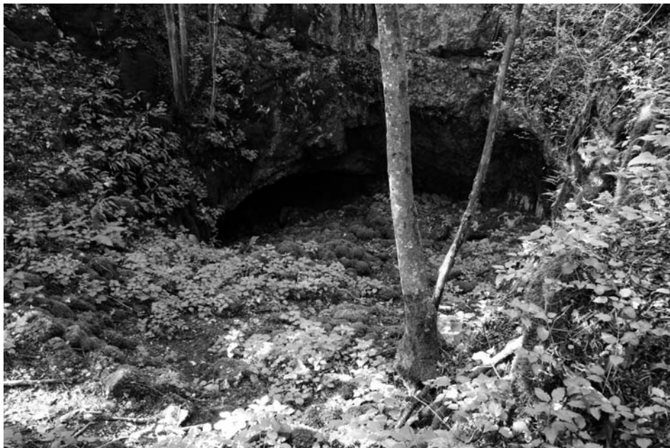
Sl. 2. Stena udornice nad spodmolom Triglavca.

Pri razpravi o nastanku imena vasi Divača ne morem mimo pripovedk iz zahodne Slovenije, ki jih je zbral Medvešček (2006; 226), tu preseneča kamen devar , o katerem mu je informator pripovedoval leta 1965 v brkinski vasi Hujje pri Pregarjah. Tako so pravili kapniku stalagmitu v skrivni rupi (jami) pri Hujah, ki je imel obliko falosa in naj bi po-