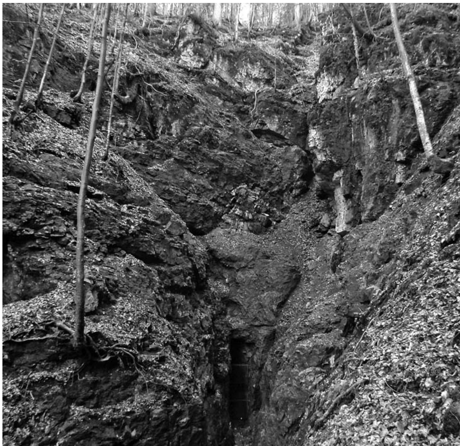
Slika 2. Izvir Trbuhovica.

Zgrajena je bila okoli 1851, sedanji videz pa je dobila pol stoletja pozneje. Poznanih je več pripovedi o njenem nastanku. Ena pravi, da so jo postavili v zahvalo, ker med kugo