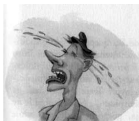
Primer ilustrativnega gradiva Trapa v berilu Kdo se skriva v ogledalu?