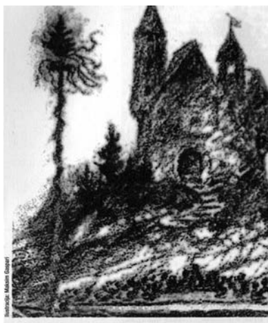
Primer ilustrativnega gradiva pravljice Železni prstan v berilu Kdo se skriva v ogledalu?