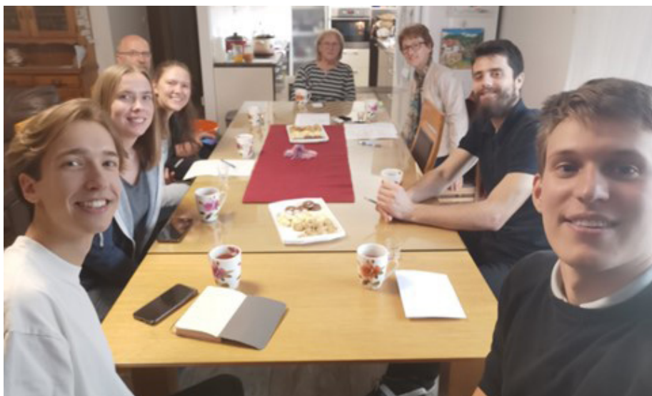
Slika 9: Na obisku pri domačinih v Vidmu, 15. maj 2024

2.6 Med delom smo vedno znova ugotavljali, da slovaropisno delo v okviru pedagoškega procesa zahteva usklajeno skupino študentov, ki se drži tako pravil izdelave kot rokov oddaje. Nekoliko lažje je bilo, ker so bili predmeti izbirni, študentje pa so na začetku izvedeli, kaj jih čaka, in so še imeli možnost zamenjati predmet. Poudarim naj, da je tako delo izredno zahtevno tudi za pedagoga, saj mora nepretrgoma usklajevati več vrst dela: (1) fonetično transkribiranje gradiva vnaprej ali vsaj do časa, ko dobi v pregled prve izdelke študentov (sproti je še težje); 9 (2) pripravo tabel za študente, kar zajema izrez določenega števila slovarskih sestavkov iz skupnega izhodiščnega slovarja, dobljenega od zbirateljice, pri čemer so na teden v izdelavo dobivali od deset do dvajset slovarskih sestavkov, odvisno od intenzivnosti dela v določenih obdobjih semestra; 10 (3) sledenje spremembam