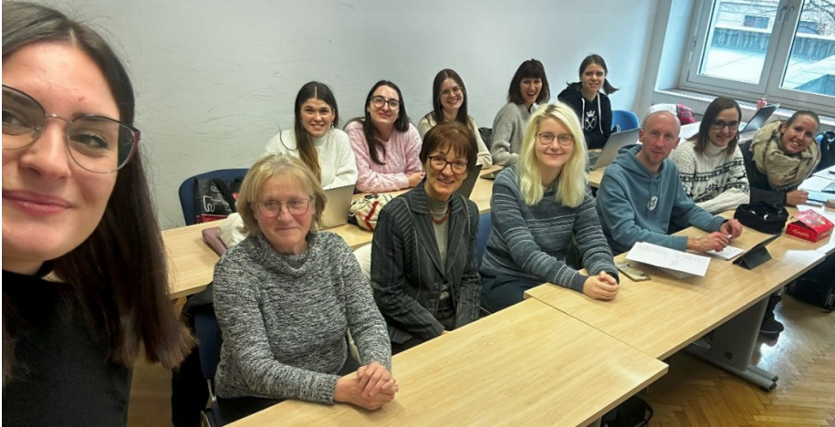
Slika 7: Ob koncu delovnega srečanja v predavalnici, 13. december 2023

2.5 Vsaka skupina se je z zbiralko tudi srečala – dve v predavalnici, dve na njenem domu. Srečanja so bila zelo koristna, saj so povečala medsebojno zaupanje in omogočila dodaten uvid v delo ene in druge strani. Na njih smo skupaj predelovali težavnejše dele slovarja, pridobivali dodatne razlage leksemov in odpravljali dvome, ki so ostali tudi po mojem pregledu. Tako smo ponovno ugotovili, kako naše slovaropisno delo še zdaleč ni zaključeno ter da bodo pred izdajo potrebni še številni popravki in uskladitve, ki jih bosta pred natisom morali opraviti zbirateljica in strokovna vodja.