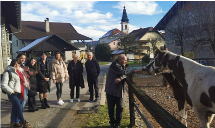
Slika 8: Na obisku pri domačinih v Vidmu, 17. december 2024