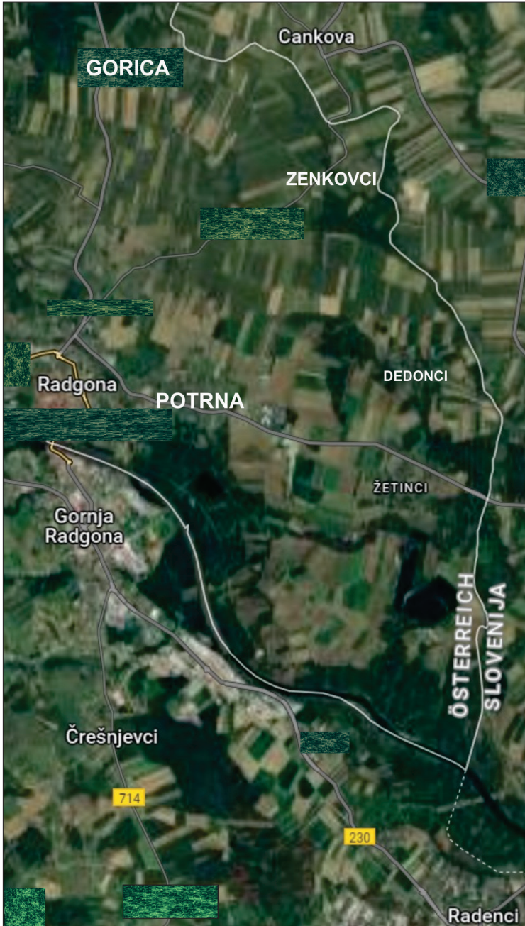
Karta 1: Mreža obravnavanih krajev