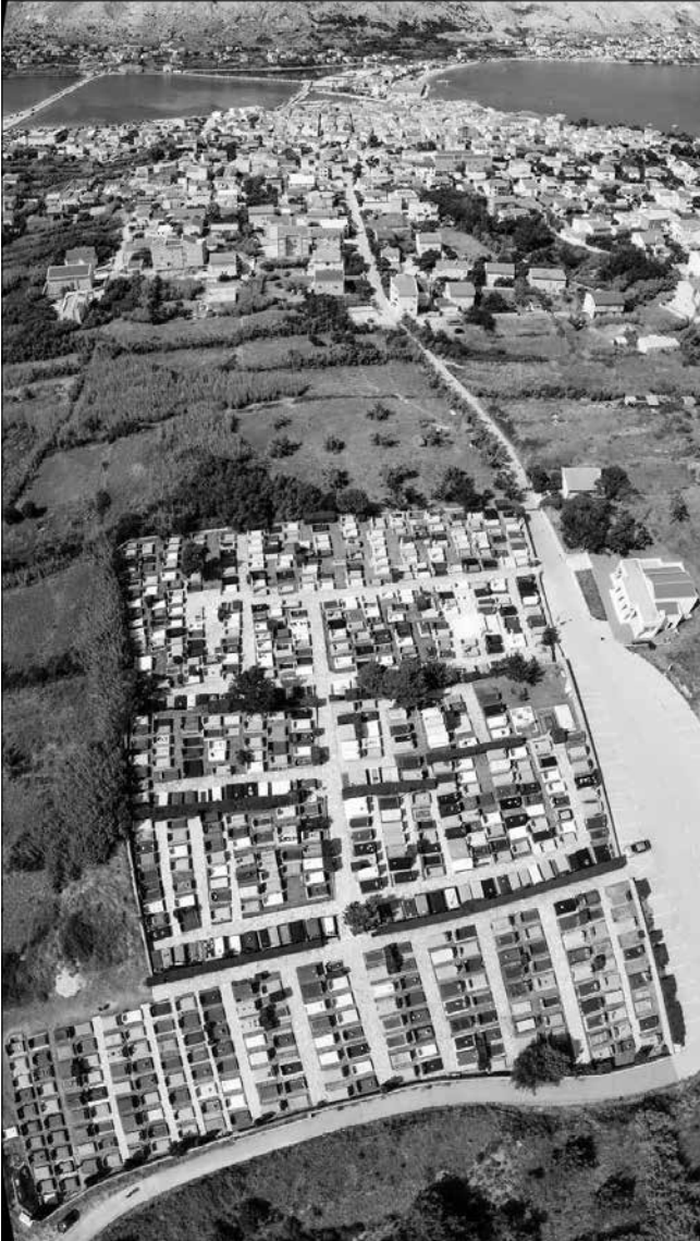
Slika 4: Fotografija groblja sv. Karin u Pagu s gradom Pagom u pozadini