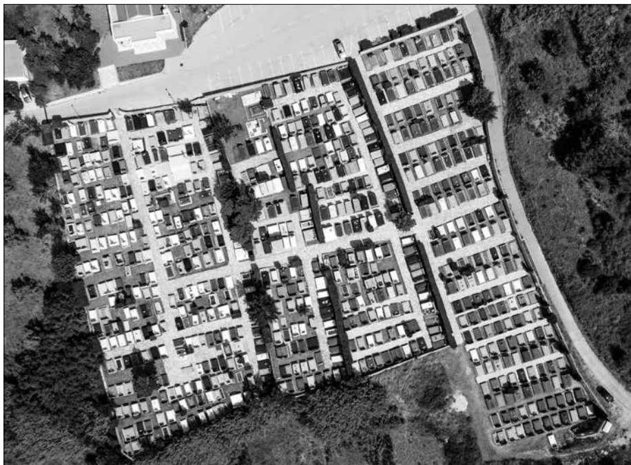
Slika 3: Fotografija groblja sv. Karin u Pagu iz ptičje perspektive

spomenika na kojima su natpisi zabilježeni, čini otprilike 17,8 %. Najčešći su frazemi: počivati u miru b/Božjem – 27 puta, počivati u miru – 26 puta, podignuti spomenik – 6 puta, a od ostalih ponavljajućih frazema navodimo: tihi dom – 3 puta, darivati <komu> vječni pokoj, pokoj vječni, Ja sam uskrснуće i život, RIP / Riposino in pace, podignuti spomen, u tuzi i boli, s ljubavi po 2 puta. Prethodno spomenuta ograničenost i (relativna) jednoličnost korpusa potvrđuje se u činjenici da omjer frazema koji se opetovano koriste u epitafima s ukupnim brojem frazema iznosi otprilike 55,5 %. Pa ipak, mišljenja smo, a to će potvrditi i rasprava koja slijedi, da je naš korpus dovoljno reprezentativan i raznovrstan te da se na osnovi njega mogu, u kvantitativnom i kvalitativnom smislu, dobiti vrijedni podatci. Također je važno napomenuti da je riječ o relativnoj opetovanosti frazemskih oblika jer se pojedini oblici razlikuju po rodu, broju i glagolskome vremenu i načinu (prezent, perfekt, imperativ), npr. frazem počivati u miru u epitafima ima zabilježene različite oblike, međutim, sve ih promatramo unutar jednog citatnog oblika – počivati u miru (< počiva u miru, počivao u miru, počivala u miru, počivaju u miru, počivali u miru, počivaj u miru ).