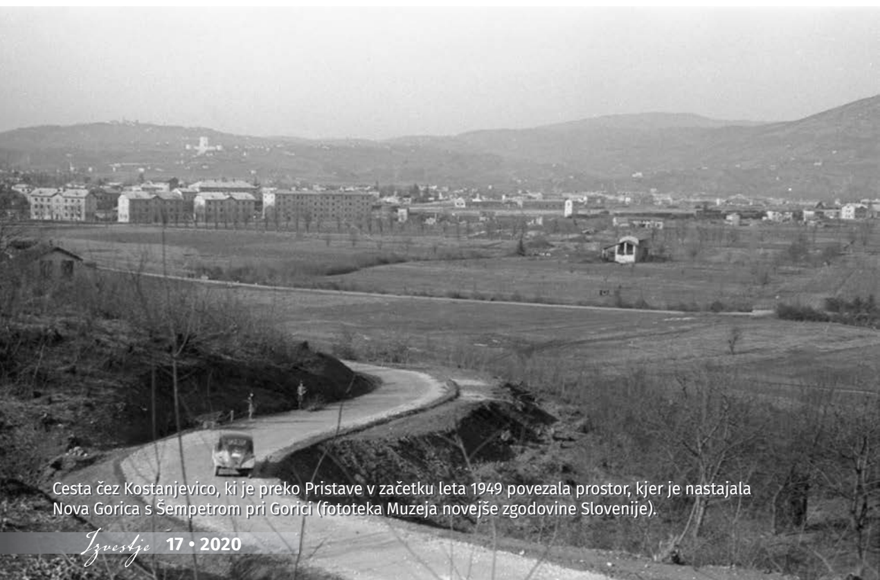
Cesta čez Kostanjevico, ki je preko Pristave v začetku leta 1949 povezala prostor, kjer je nastajala Nova Gorica s Šempetrom pri Gorici.