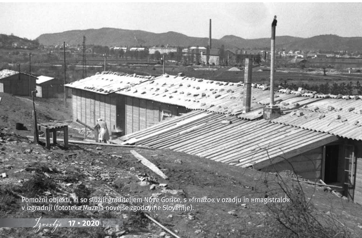
Pomožni objekti, ki so služili graditeljem Nove Gorice, s »frnažo« v ozadju in »magistralo« v izgradnji.