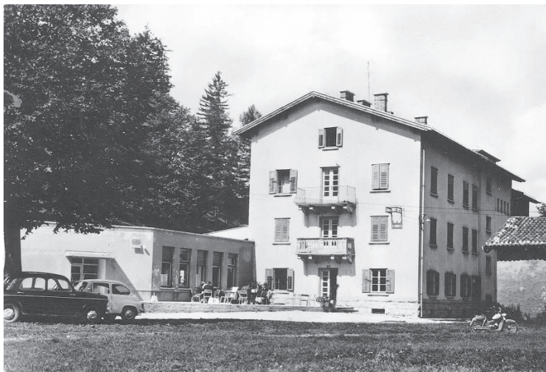
Lokve, razglednica s hotelom Poldanovec.

novi kot pri pospeševanju turističnega razvoja območja. 3