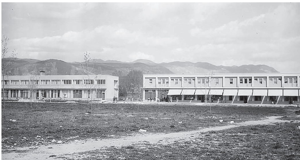
»Komunalna bloka« na nekdanji Cesti 5, današnji Delpinovi ulici v Novi Gorici.

tržnico. Ob Cesti 5 so tako leta 1957 začeli graditi tako imenovane komunalne bloke, skromne enonadstropne objekte, najprej prva dva in leta 1960 še tretjega. V prvem so namestili pekarno in obrtno in trgovinsko zbornico, v drugega (danes je to Delpinova 12) so investirali Živinopromet Gorica, trgovina Prehrana, trgovina Tekstil-galanterija in trgovsko podjetje Sadje-zelenjava. Za vse navedene trgovine Teodor Lojk v tehničnem poročilu piše, »da ne bi imele posebnih običajnih izložbenih oken, ampak bi trgovine kot celota bile že istočasno tudi izložbe.« (PANG, OLO Gorica: t. e. 475)