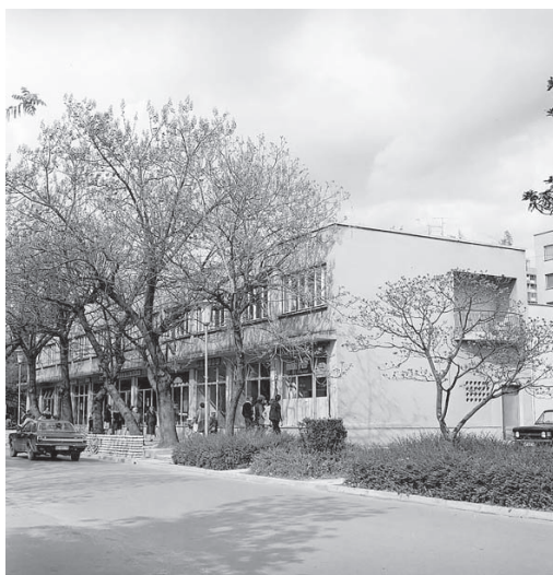
Nekdanji utrip na Delpinovi ulici v Novi Gorici.

dobro, dokler kriza ni bila rešena, ustanovili svoje gradilišče. » (PANG, t. e. 941)