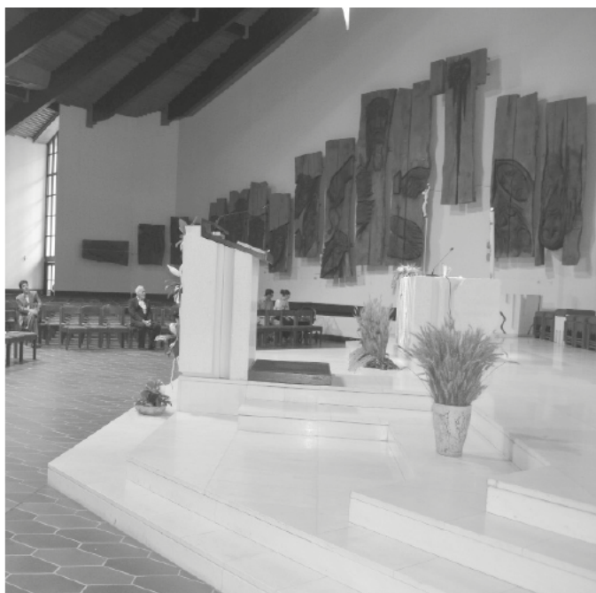
Slika 4: Notranjost cerkve Kristusa Odrešenika.

ko« (AŽNG, Župnijska cerkev: 2–3; Razglasitev 2004: 17–18; Ilich Klančnik 2012: 67–70).