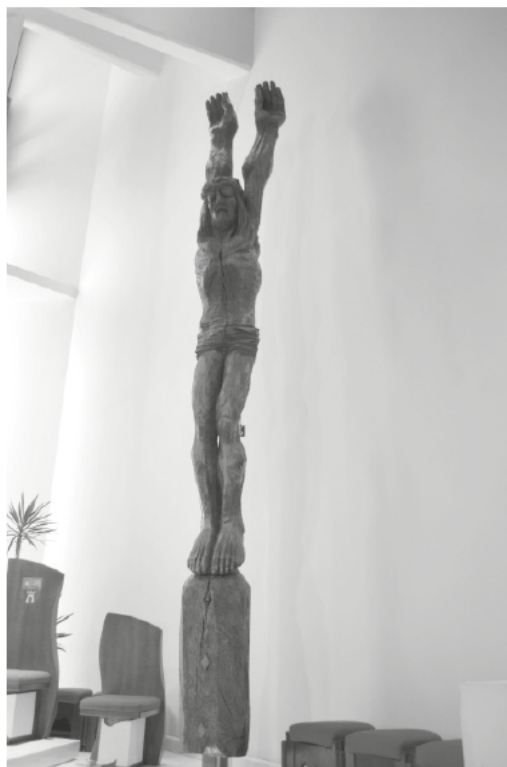
Slika 3: Leseni kip Kristusa.