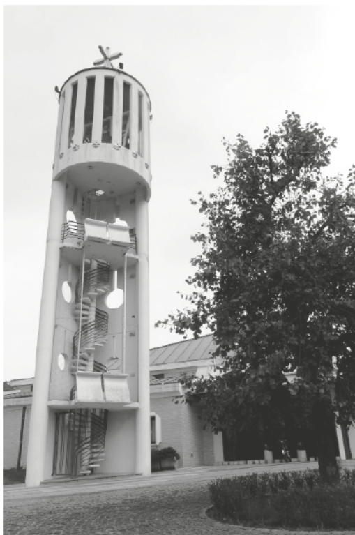
Slika 2: Zvonik pred cerkvijo Kristusa Odrešenika.