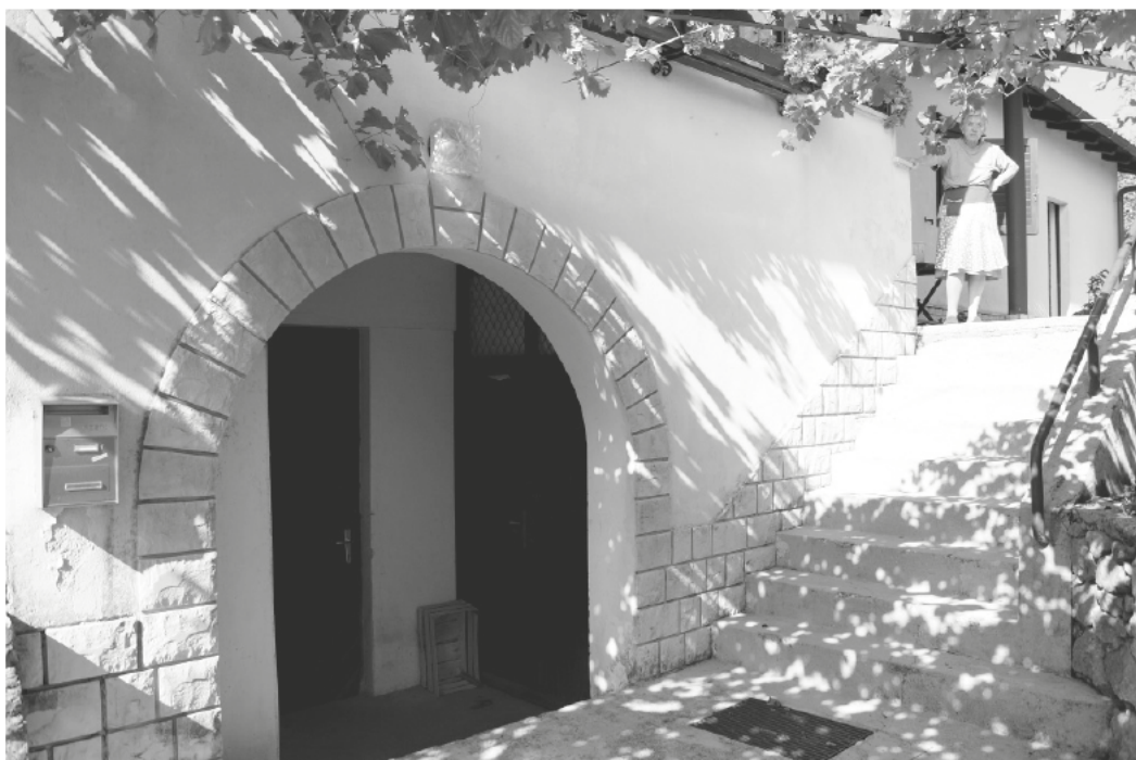
Slika 1: Kletni del in stopnišče stavbe leta 2016.

mesto vetrnika pa so ob kuhinjski niši postavili manjšo shrambo. Poleg tega so pregradili osrednji bivalni del in tako namesto dnevne sobe s kuhinjsko nišo in jedilnim kotom dobili ločeni »predimenzionirano« kuhinjo z jedilno mizo ter dnevno sobo z direktnim vhodom v stranišče in kopalnico. Vrh vsega pa so izvajalci nekatere stavbe in dnevne sobe obrnili proti severu (Šlajmer 1952: 21). Stanovalci so v nadaljevanju še naprej »samovoljno« uničevali »jasen tlorisni koncept« – v posamičnih primerih so bili dodani obsežni prizidki, tako da so prvotni gabariti le težka razpoznavni, drugod pa so predstavljali okenske in vratne odprtine ter postavljali in podirali vmesne stene (Grilanc, 2016; Markič J. 2016; Markič M. 2016). 3