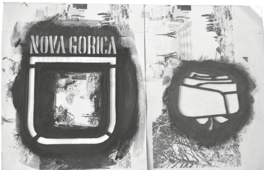
Slika 1: Predloga za grb Nove Gorice (PANG 731, Jože Srebrnič, t. e. 1, a. e. 3).

la, saj sta bila od štirih prejetih osnutkov, ki so bili tedaj razstavljeni v avli skupščine, dva ustrezna, ker sta: »Upoštevala elemente domače tradicije oz. sta na najbolj razumljiv način poudarila katero od značilnosti novega mesta« (PANG, t. e. 1330), kot je komisija utemeljila prispela osnutka. Osnutka sta bila oddana pod dvema šiframa: »Kras«, ki je predstavljal ljudski motiv, kakršnega najdemo na kraških, kamnoseških delih in skrinjah, pod šifro »171167« pa je bila v zaokroženem ščitku rahlo stilizirana vrtnica.