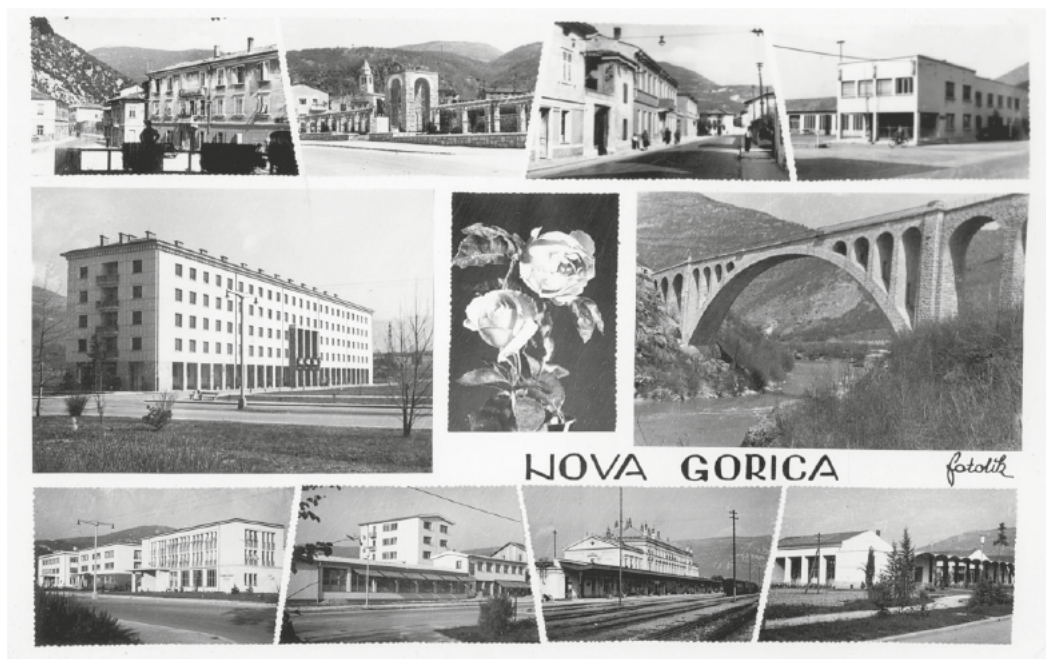
Slika 3: Razglednica Nove Gorice.

Skupščini občine Nova Gorica pa se je avtor, inženir arhitekture, od simbola distanciral.