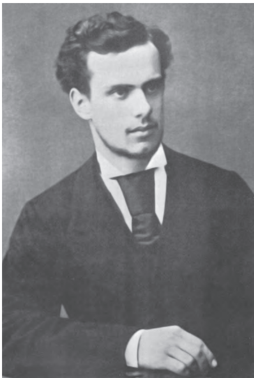
Portret mladega Kugyja.