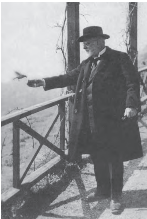
Kugy v poznejših letih.

Kugy je umrl 5. februarja 1944 v šestinosemdesetem letu starosti na svojem domu v Trstu. Njegova zapuščina je bila razdeljena med sorodnike, kar je od nje ostalo pa je zakurila gospodinja Pepina Malalan. 11 V knjigi Aus dem Leben eines Bergsteigers je o sebi in svojem udejanjanju v gorah razmišljal takole – in to naj bodo zaključne misli: »O bitnosti hribovca nisem nikdar v življenju dosti premišljeval. Razprave o upravičenosti gorskega športa, o hoji z vodnikom in