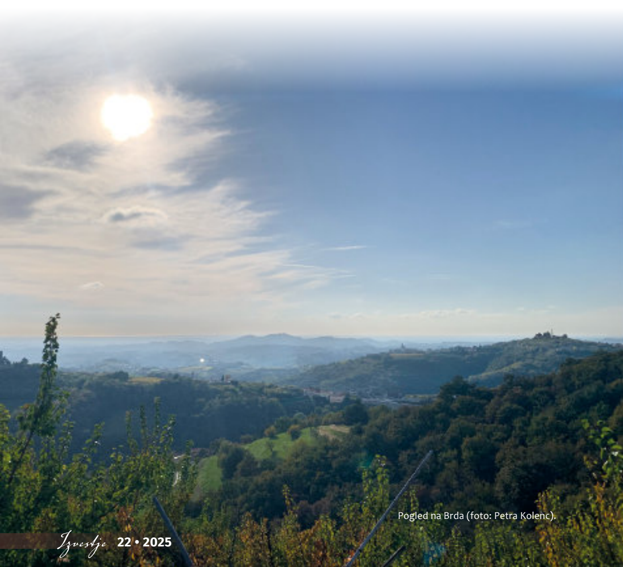
Pogled na Brda.

Spletni vir 7: Circular models Leveraging Investments in Cultural heritage adaptive reuse, https://www.clicproject.eu/about/ (dostop 29. 1. 2026).