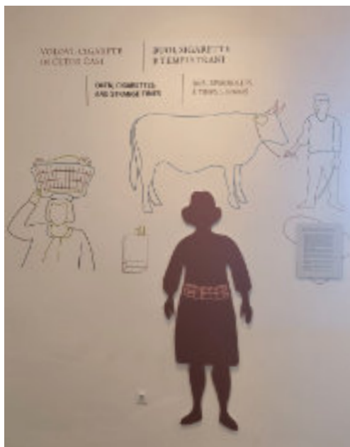
Iz razstave Na stičišču svetov na gradu Dobrovo v Brdih.

Kasneje, ko se je meja nekoliko omilila, so ženske začele hoditi v Italijo legalno. Prodajale so jajca, maslo, meso. A s tem so se odprle nove možnosti za tihotapljenje. Cigarete so postale dragocene kot zlato. Vsaka škatlica je prinašala dobiček, vsak korak čez mejo pa tveganje.