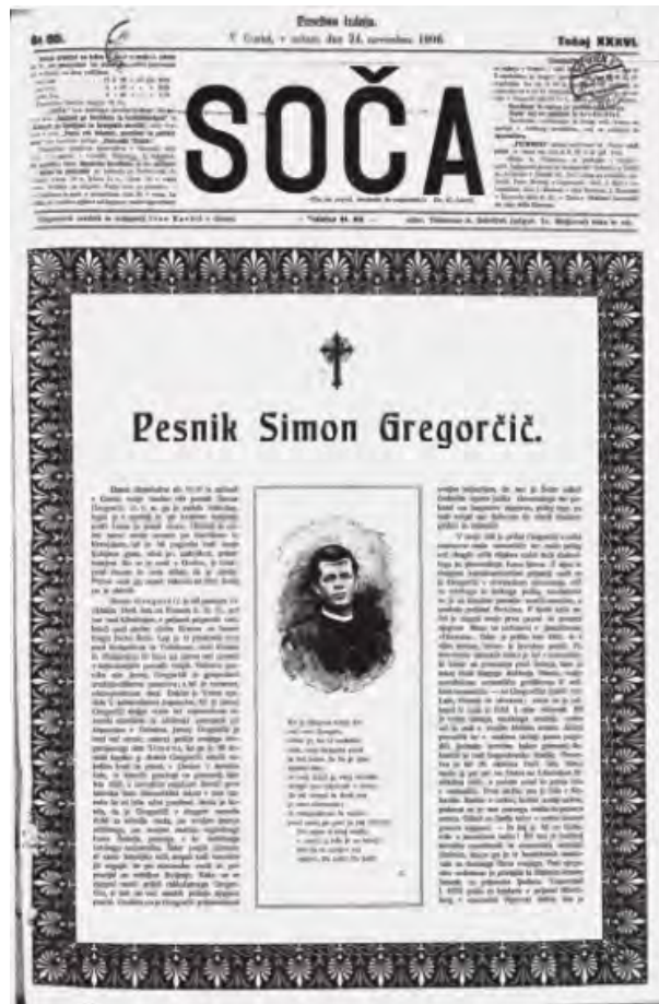
Posebni številki časopisov Gorica in Soča posvečeni Simonu Gregorčiču.

fotografije). Vest so povzemali vsi slovenski časopisi, Gorica in Soča pa sta mu posvetili posebno številko (oba št. 95). Slovenski katoliški literarni mesečnik Dom in svet je nekaj dni po pogrebu povzel, da se je Gregorčič priljubil narodu, ker je združil »preprostost narodne pesmi s svojimi bogatimi motivi, žarki idealizem s tihim, nežnim svetožaljem. On je postal pesnik ljudstvu, vzor mladini, tolažba razdvojenim.« (Dom in svet, 19, 1906, št. 12, 782) Pesnik in duhovnik Anton Aškerc pa je v Gorici med drugim zapisal: