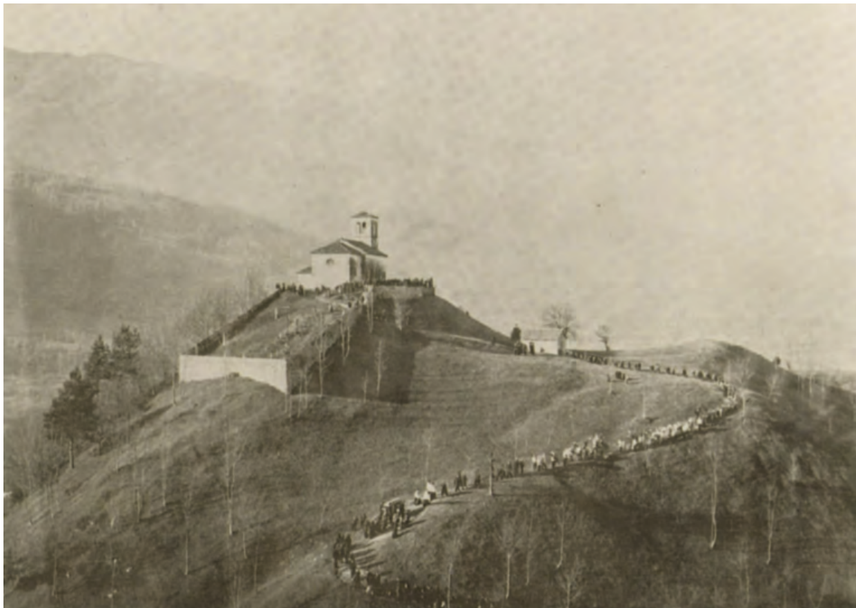
Slovo od Simona Gregorčiča, pogrebni sprevod proti cerkvi sv. Lovrenca.

treba razlagati na dolgo in široko. To ve vsak Slovenec. Kakor svetla zarja je šla njegova pesem po slovenski domovini, žarela je, razsvetlila in razgrela slovenska srca. Ko je leta 1882. izdal svoje prve pesmi, je segel narod po njih, vzela v sé in današnji dan zvenijo iz njegovih ust [...] Zatisnil je trudne oči, in Slovenija plače ob rakvi svojega velikega sina.« (Soča, 24. 11. 1906) Gorica pa se je spraševala tudi o presežnosti, ki se je izražala v poklicanosti poeta tako za duhovniški poklic kot za muzo, ki ji je služil: »Če je res poezija 'poslanka mila iz neba' in od božanstva navdahnjen pesnik njen srednik med nebom in zemljo, njen svečenik in namestnik na zemlji, tedaj je bil Gregorčič skoz in skoz tudi svečenik boginje Poezije.« (Gorica, 27. 11. 1906)