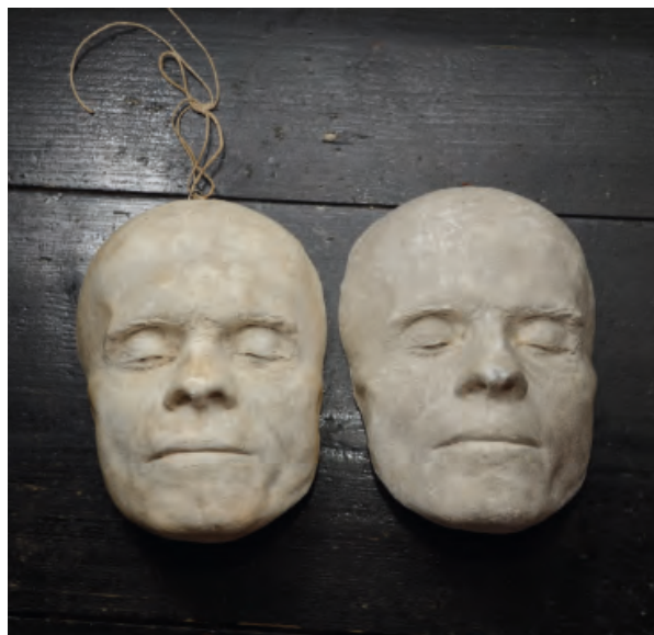
Gregorčičevo posmrtno masko je na mrtvaškem odru leta 1906 posnel Svitoslav Peruzzi, danes je razstavljena v pesnikovi rojstni hiši na Vrsnem. Hrani Tolminski muzej.

Še podrobneje je čez nekaj dni o pogrebu pisala Gorica, ki je med drugim poudarila