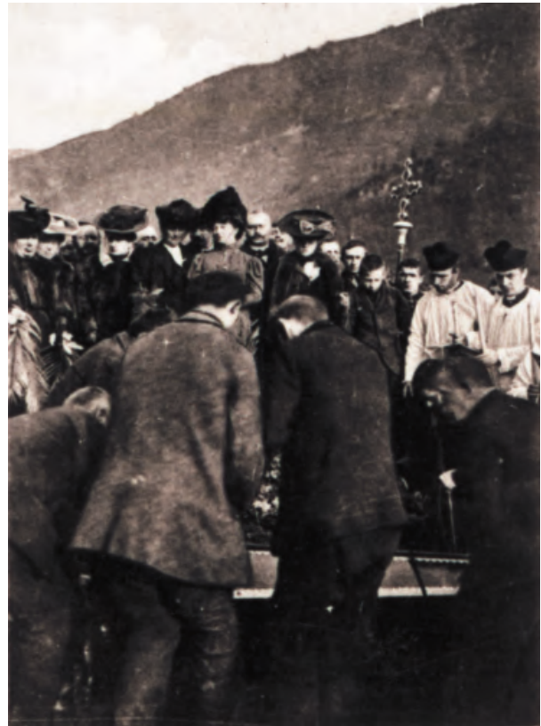
Polaganje Gregorčičeve krste v grob pri cerkvi sv. Lovrenca.