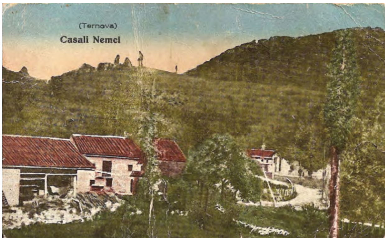
Razglednica zaselka Nemci nastala za časa Italije, kar je razvidno iz italijanskega poimenovanja vasi Casali Nemci.

Z dokončanjem izgradnje ceste iz Kromberka v notranjost Trnovskega gozda v letu 1758 se je končalo obdobje dotedanjih prebirnih sečenj 16 , ki so močno škodile Trnovskemu gozdu. Začelo so je obdobje rednih sečenj, ki je bilo povezano tudi z izgrajeno prvo cesto v Trnovskem gozdu, po kateri je bil možen prevoz z vozovi. Šlo je za čas, ko je mesto Gorica – tudi zaradi nastanitve dodatnega števila poklicnih vojakov – zahtevalo redno dobavo večje količine lesa. Hkrati pa je bil to čas, ko je Goriška beležila rast prebivalstva. 17