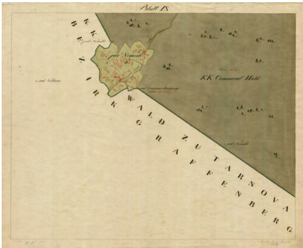
»Per Nemzih« je ime zaselka zabeležil Franciscejski kataster za Primorsko (1811–1869). Nemci so tedaj sodili pod katastrsko občino Lokve (vir: SI AS 179, G117 Lokve, k. o.).