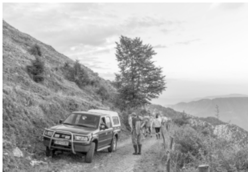
Terensko delo v planini Sleme, 25. 8. 2022.

dr. etnologije, znanstvena sodelavka, docentka