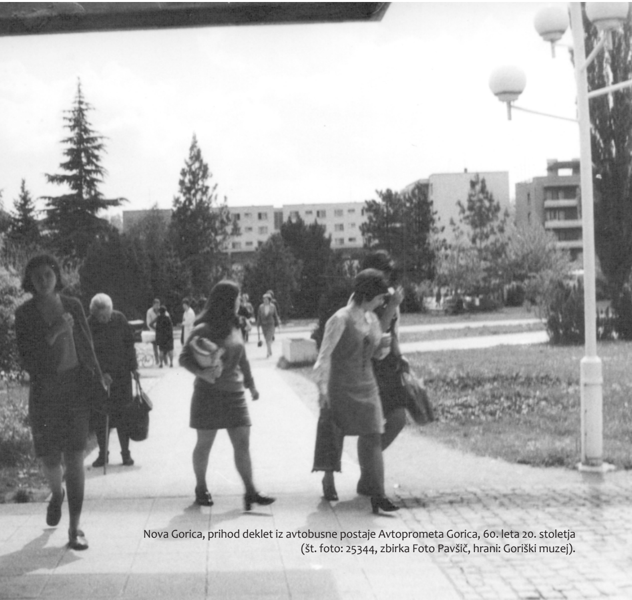
Nova Gorica, prihod deklet iz avtobusne postaje Avtoprometa Gorica, 60. leta 20. stoletja (št. foto: 25344).

Nove dediščinske paradigme tako poudarjajo, da je treba dediščino razumeti kot socialno prakso ali proces (Smith 2006; Fakin Bajec 2011; Labrador, Silberman 2018), kjer je poudarek na kontekstu in ne toliko na samem objektu. Proces nastajanja dediščine se namreč dogaja tukaj in zdaj, podvržen je sodobnim pogledom, vrednotam, prepričanjem, družbenopolitičnim in gospodarskim tokovom. Je zelo dinamičen in včasih sporen ter raziskovalcem tudi razkriva sodobne potrebe, skrbi, izkušnje, vrednote in želje