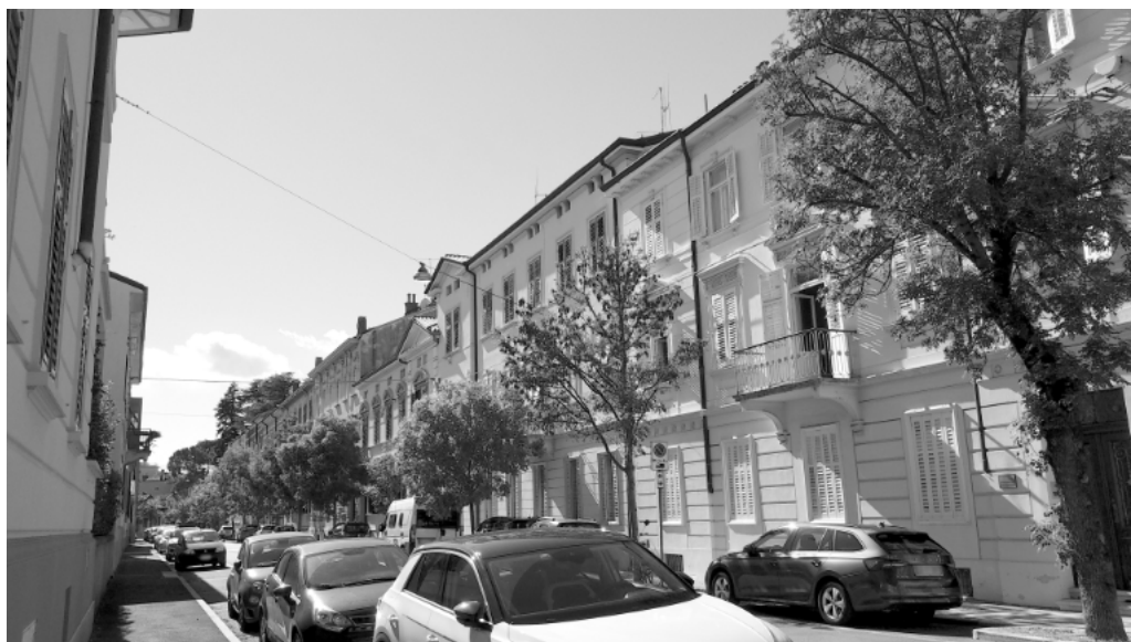
Goriška ulica Via Angiolina (foto: R. Devetak).

števílo odlične goriške gospode, katera ve pripovedovati o dobrotljivosti in prijaznosti visoke gospe. Vsled svoje zveze z visokimi krogi po krvi in svakovščini deli dobrote na vse strani ne le v gotovem denaru, ampak tudi z uplívno besedo, s katero doseže, da se izpolni marsikatera želja, ki bi sicer ostala vedno neizpolnena. Naravno je, da vsled tega je v njeni palači skoro vedno gorka kljuka, za katero prijemajo razni prosilci. Kdor želi za se ali za druge kako podporo, priznanje, imenovanje, dovoljenje, in kakor se imenujejo vse te reči v človeškem življenji, upa da pot k baronici Angelini mu ne more škodovati. [...] Posebno v osebnih in volilnih zadevah veljala je vedno kot orakel, kateri so prašali za navod, svet ali pomoč najvišje glave goriške. Kdor se je njej priporočil ter poslušal njen glas in izpolnoval njene migljeje, ni se kesal. V volilnih zadevah v mestno starešinstvo goriško dajala je včasih avtentične odgovore ter osmešila marsikoga, ki je mislil, da zna (Soča, 2. 11. 1888, št. 44).«