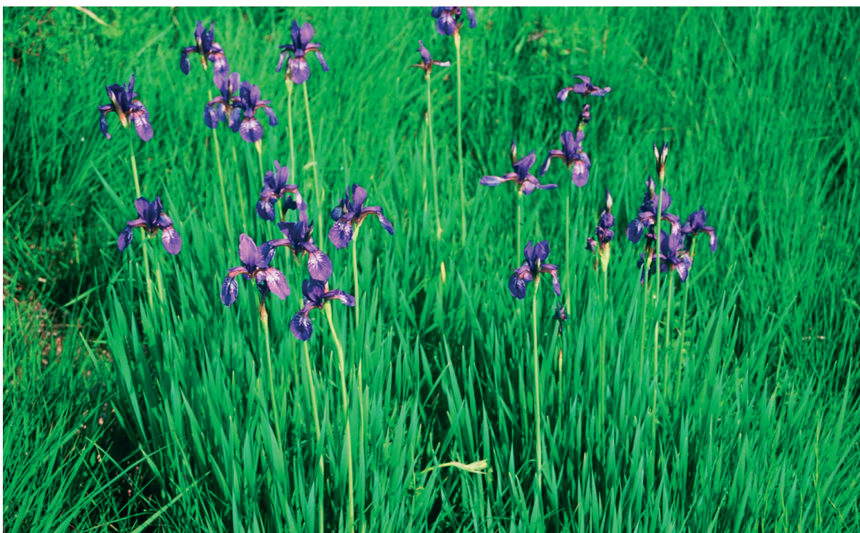
Slika 3: Kojniška perunika ( Iris sibirica subsp. erirrhiza ) na Banjšicah (Sleme). Figure 3: Iris sibirica subsp. erirrhiza on the Banjšice plateau (Sleme).