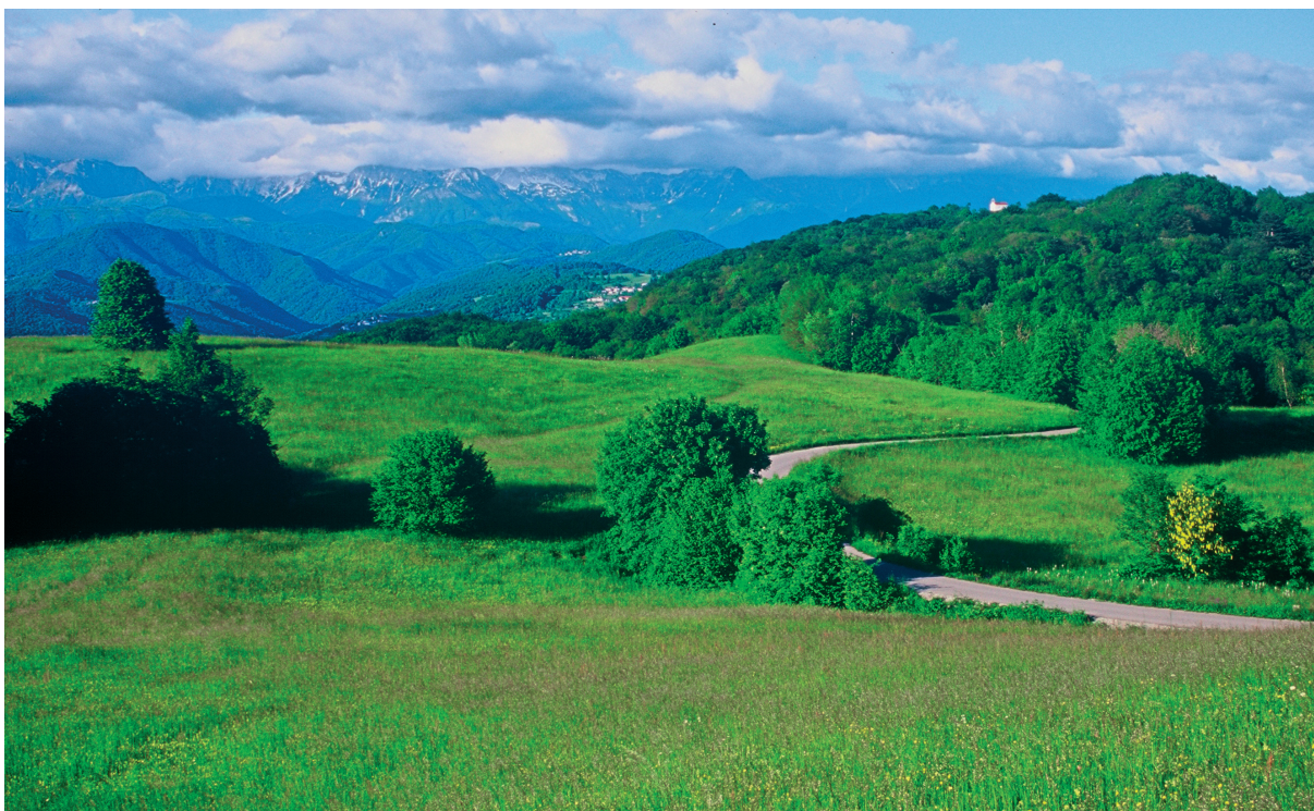
Slika 2: Kanalski Kolovrat, Pri Rajdi pod Korado, gorske senožeti, kjer raste tudi ilirski meček ( Gladiolus illyricus ). Figure 2: Kanalski Kolovrat, Pri Rajdi under Korada, montane grasslands with Gladiolus illyricus.