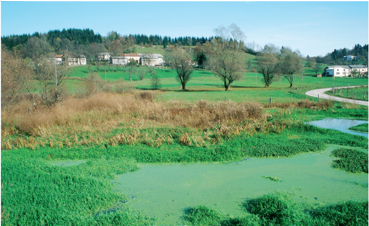
Slika 4: Mlaka pod Mrcinjami na Banjšicah, preproge grbaste vodne leče ( Lemna gibba ) Figure 4: Mlaka below the village of Mrcinje on the Banjšice plateau, carpet of Lemna gibba .