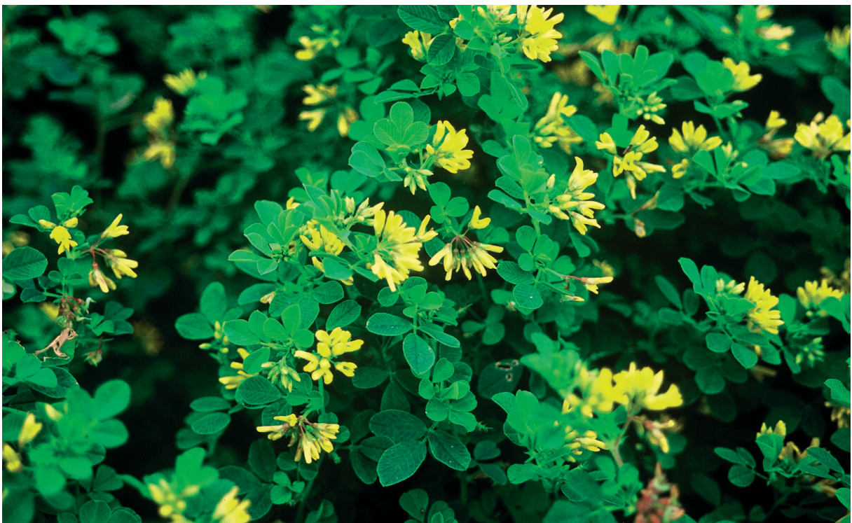
Slika 5: Pironova meteljka ( Medicago pironae ) pri Sv. Jakobu (Kanalski Kolovrat). Figure 5: Medicago pironae near Sv. Jakob (Kanalski Kolovrat)