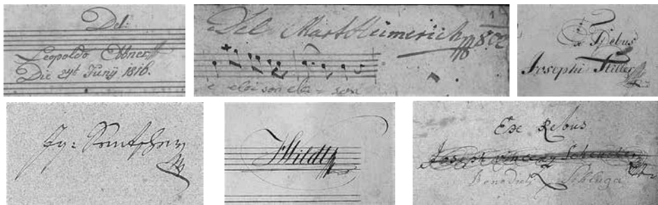
Slike 4a–4e (od leve proti desni)

Manu propria nekaterih skladateljev in prepisovalcev v SI-Co (Celje, Opatijska cerkev, Glasbeni arhiv, Ms. mus. 20b, 37, 99 (zgoraj) in Ms. mus. 130, 125, 164 (spodaj); z dovoljenjem).