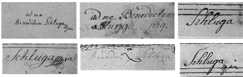
Slike 2a–2e (od leve proti desni)

ki je že dotlej poučeval na stari celjski šoli ter se poslej javlja (poleg organista) kot 'regens chori', tj. kot dirigent 37 je nato leta 1810 nasledil prvega ravnatelja glavne šole, minoritskega patra Mansueta Zanggerla, ter vodil šolo vse do upokojitve leta 1820. 38 Umrli je leta 1834. 39 Prepisal je vsaj petinsedemdeset enot duhovnih in posvetnih kompozicij, prav tako je avtor več kontrafaktur.