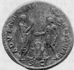
Najdba rimskih novcev, Ptuj 1962. Römischer Münzfund, Ptuj 1962.