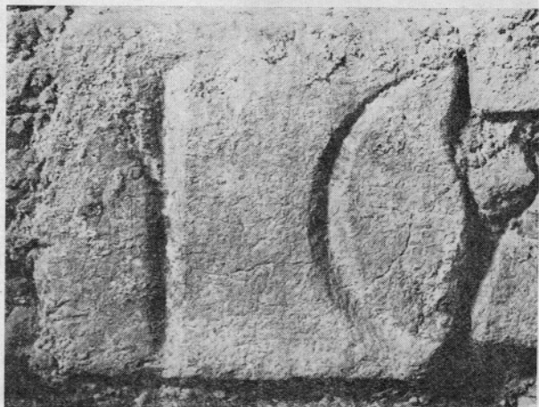
4 (gl. str. 180)