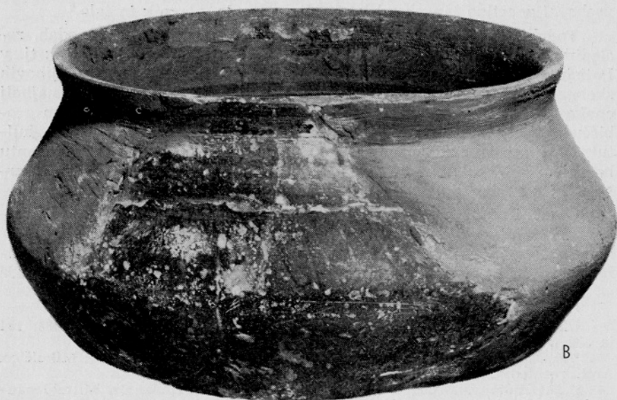
Sl. 3. Kranj, Mestna hiša. Glinasta skleda