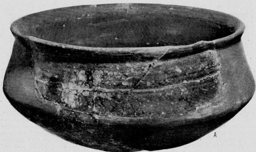
Sl. 2. Kranj, Mestna hiša. Glinasta skleda