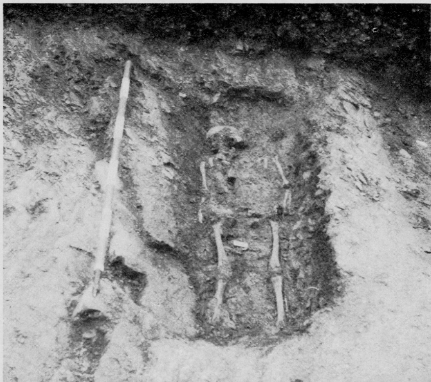
Sl. 2. Batuje. Grob 57