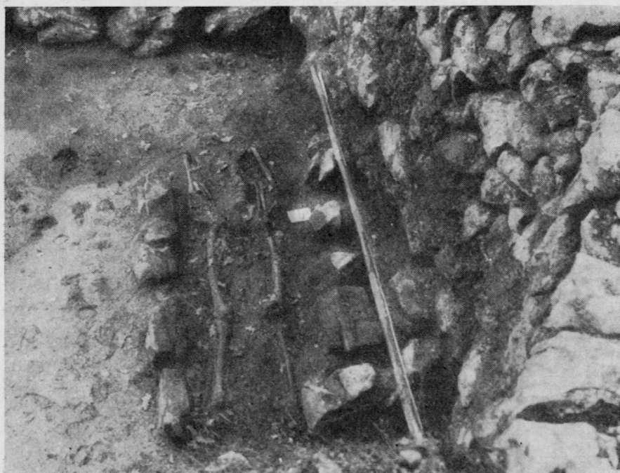
Sl. 5. Sv. Pavel nad Vrtovinom. Grob 4 Fig. 5. Sv. Pavel nad Vrtovinom. Tombe 4