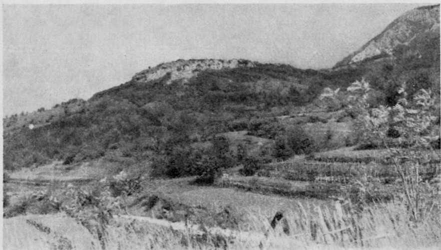
Sl. 4. Sv. Pavel nad Vrtovinom Fig. 4. Sv. Pavel nad Vrtovinom