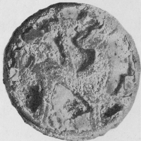
Sl. 3. Batuje. »Agnus dei«, upodobljen na emajlirani bronasti fibuli (grob 25)

trije vkopani v tlak neke antične stavbe, v četrtem (grob 4), ki je bil vkopan v ruševine obrambnega zidu, pa je ob skeletu ležala železna puščica s tordiranim tulcem in ostjo v obliki lastavičjega repa, poleg nje pa igla — stilos, prav tako iz železa. 31 Podobna puščica je bila najdena po drugi svetovni vojni, pri obnovi porušene cerkvice sv. Pavla. 32 Puščice tega tipa na zgodnjerednoveških najdiščih niso redke, časovno jih opredeljujejo datirane najdbe iz Dalja in Jakovo—Surčina v 6.—8. stoletje. Oblikovno puščice s tordiranim tulcem kažejo bizantinski vpliv. 33 Grob 4 je bil orientiran v smeri vzhod—zahod. Pridevki v grobu 4 so premalo izraziti za etnično opredelitev ne samo groba, ampak naselbine sploh. Posamezne zgodnjerednoveške najdbe v sami naselbini, pomešane s poznoantičnimi (kresilo) prav tako ne zadostujejo za zanesljivo opredelitev nosilcev, čeprav najbrž ni zgrešeno pripisati Slovencem naselbino na Sv. Pavlu v času po letu 568.