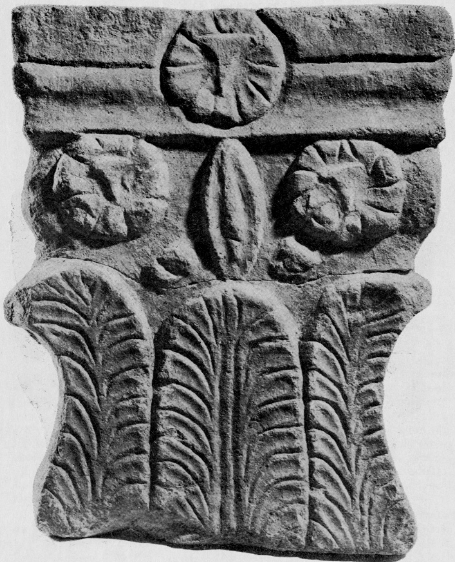
Sl. 2. Ljubljana, Ferantov vrt (Gradišče 14) — insula XX. Kapitel pilastra Fig. 2. Ljubljana, le jardin de Ferant (Gradišče 14) — insula XX. Chapiteau d'un pilastre