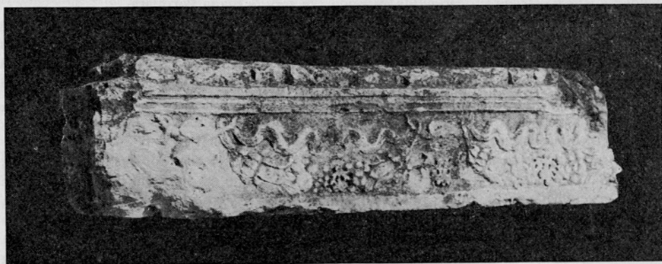
Sl. 2. Ulomak gredice iz uvale Valkanela ukrašen girlandama, koji se nalazi s južne strane romaničke bazilike Majke Božje od Mora u vrsarskoj luci

Ostaci spomenute stambeno-gospodarske zgrade na području radionice »Neon« svjedoče da je Vrsar u doba antike bio naseljen u I st. n. e. U II i III st. on je bio gospodarski centar