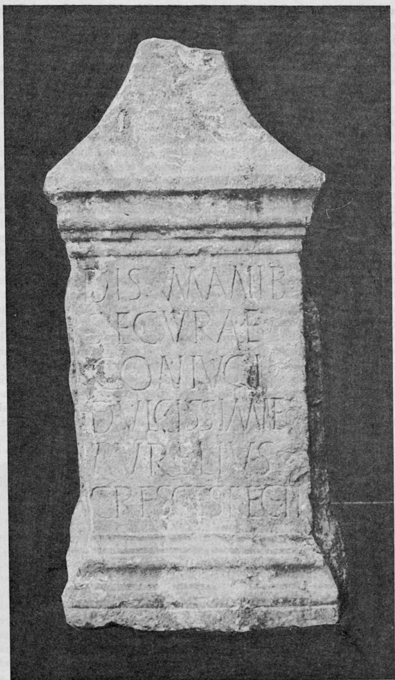
Sl. 1. Nadgrobni spomenik Sekure iz Vrsara — Fig. 1. Orsera, cippo funerario