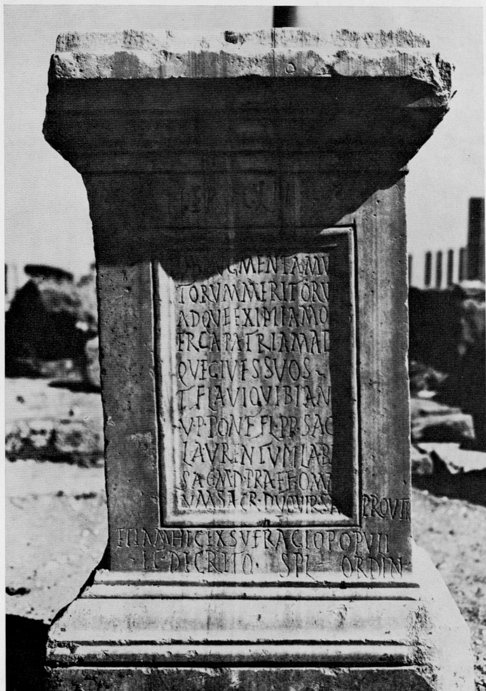
2 IRT 568: hommage offert par l'ordre des décurions à T. Flavius Vibianus (voir fig. 1). — Besedilo poklonitve mestnega sveta Titu Flaviju Vibijanu (glej sl. 1)