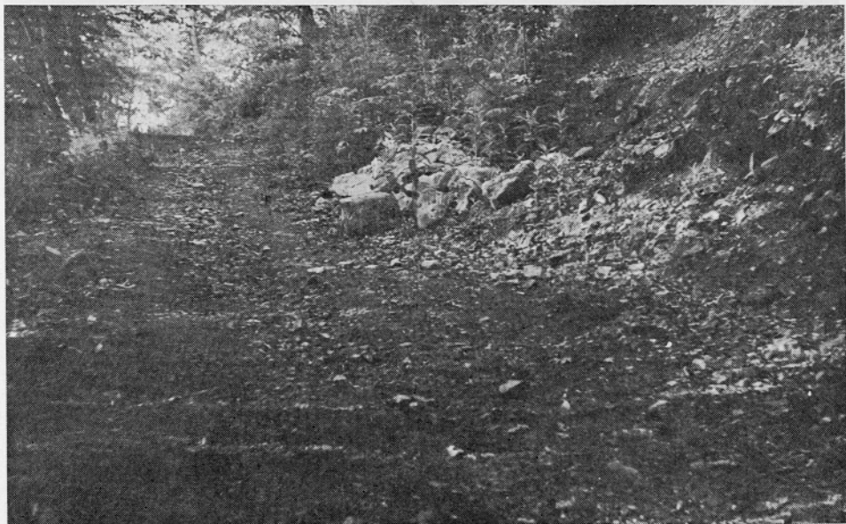
2 Ostanek porušenega obrambnega zidu na severovzhodnem pobočju hriba. — Remains of ruined defence wall on the north-eastern slope of the hill

Naslednje najdbe, ki jih lahko uvrstimo v iztekajoče obdobje, nekoliko pred slovansko doselitvijo, je odkritje groba na srednjem delu terase, v sektorju, odkoder se proti jugu nadaljujejo staroslovanski pokopi. 28